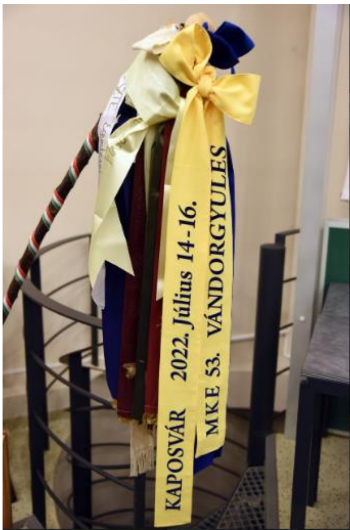
A vándorgyűlés „vándorbotja”