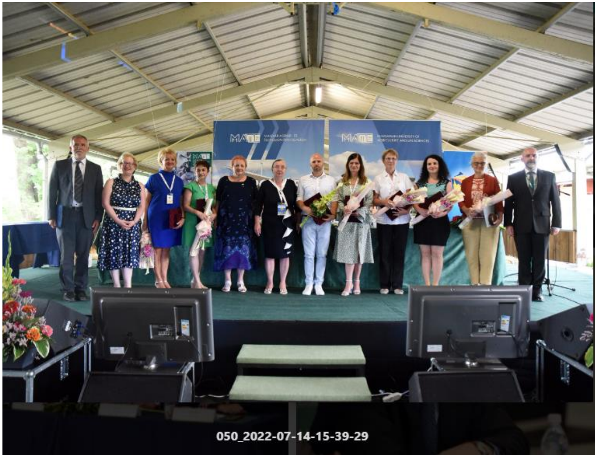
A 2022. évi kitüntettek