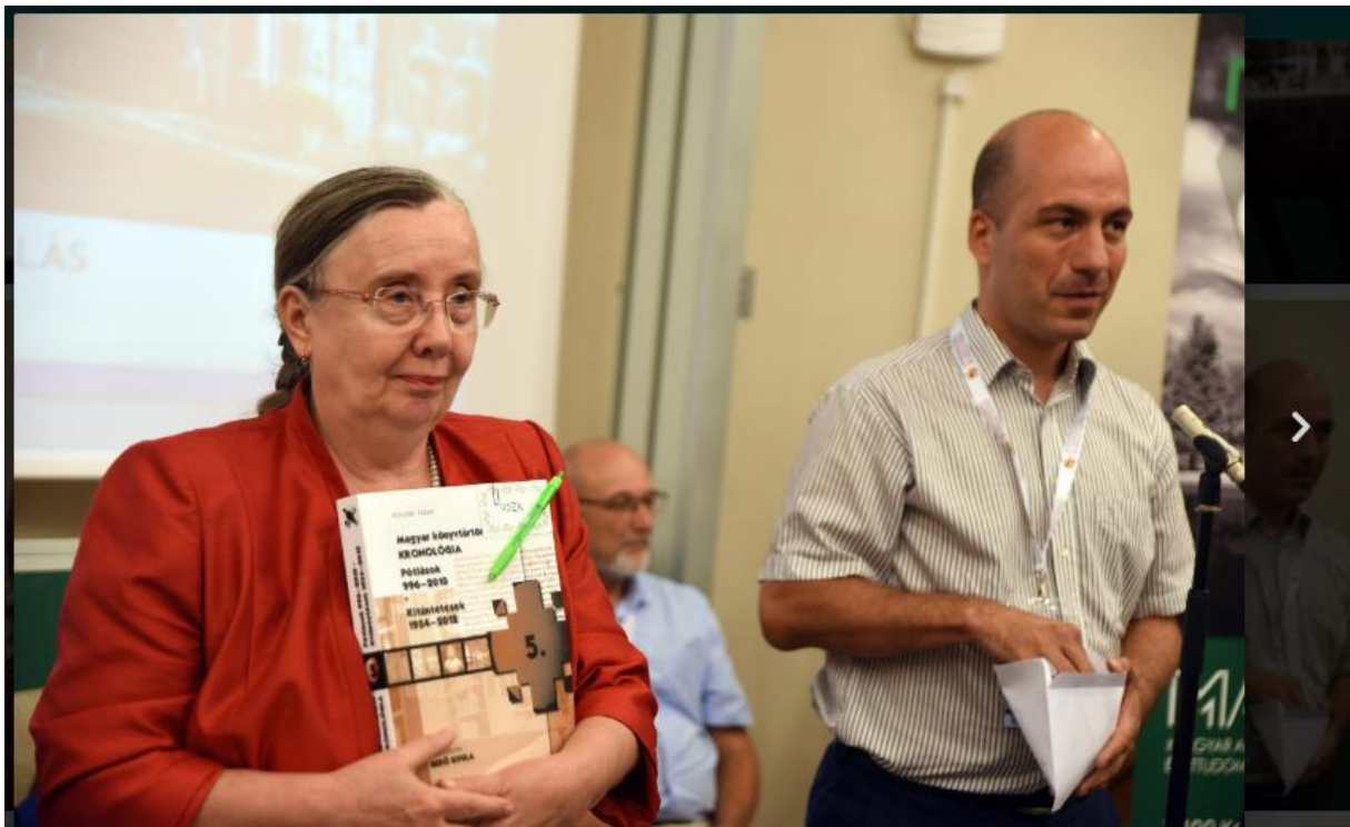
Záró plenáris ülés