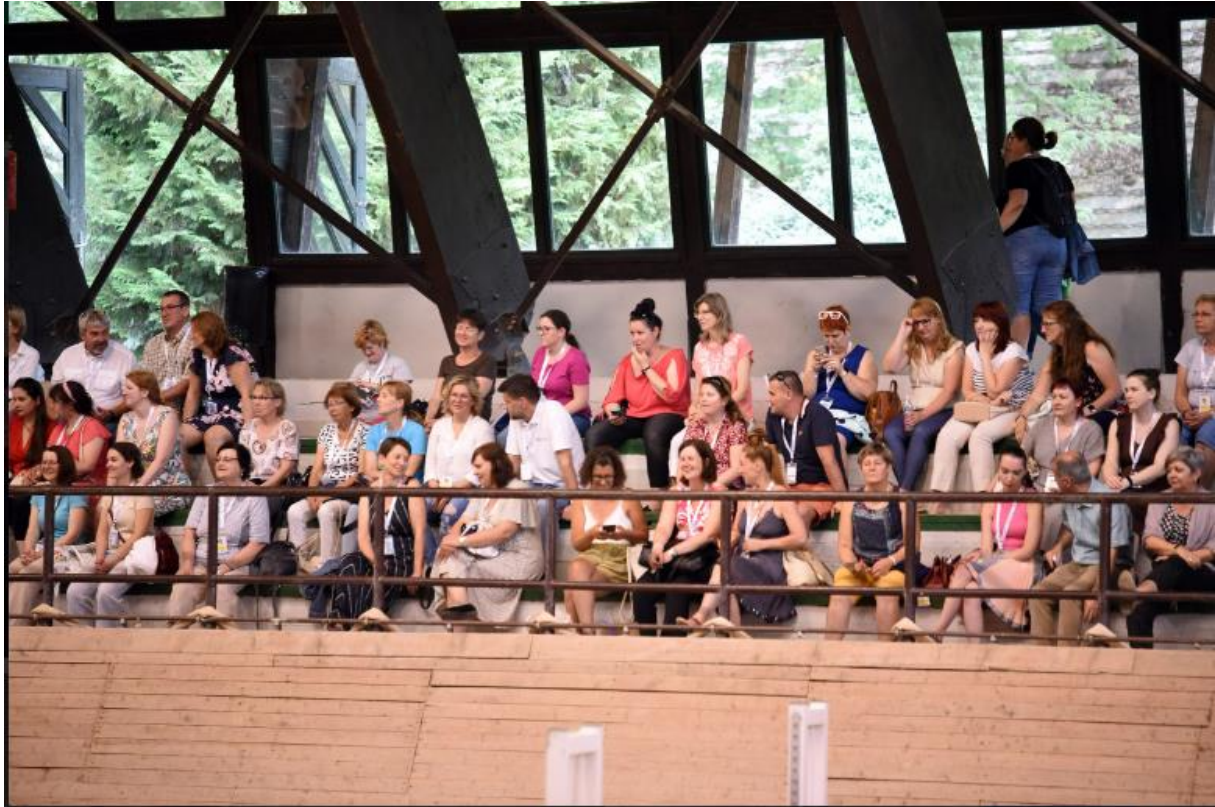
Kulturális program résztvevői