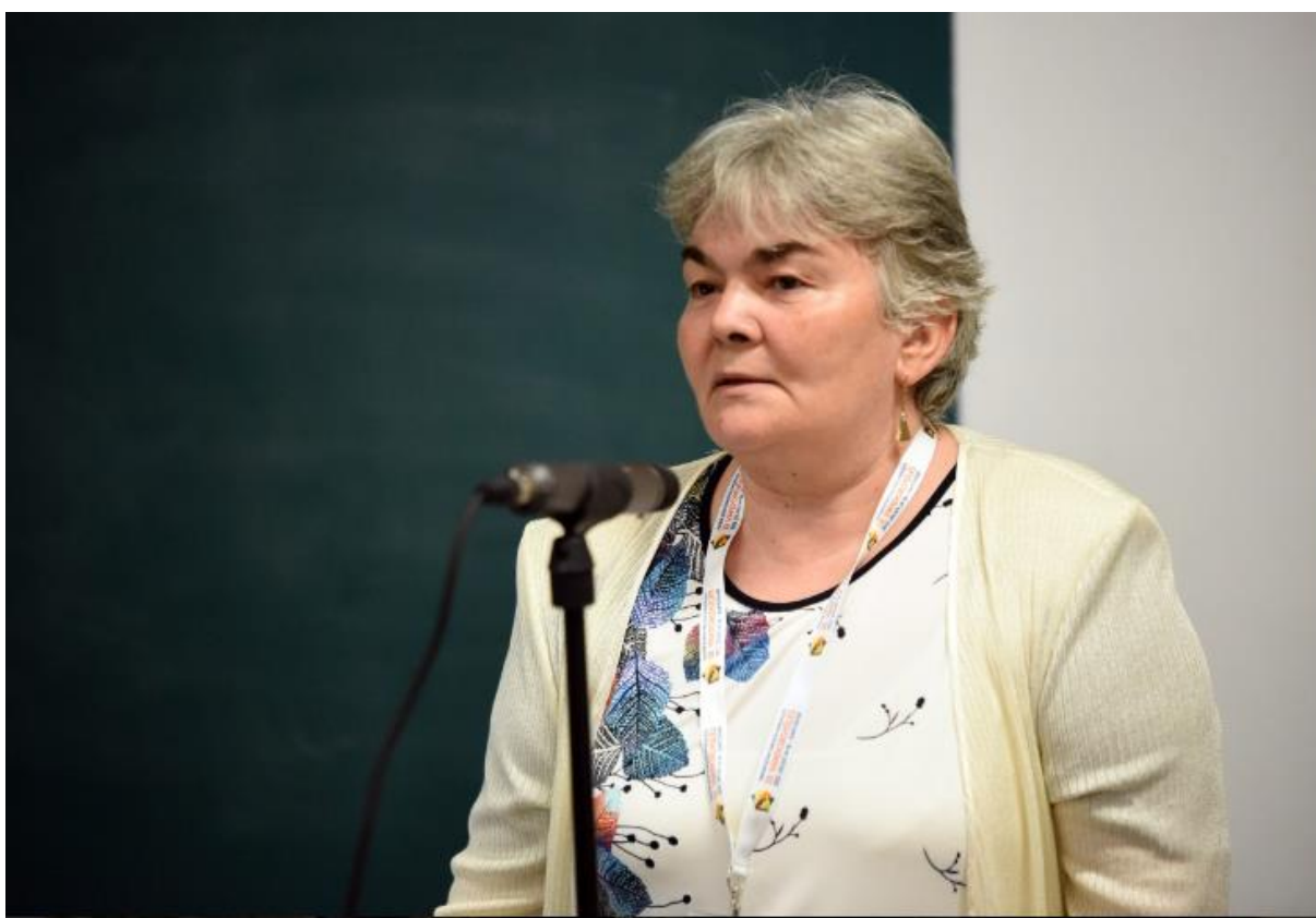
Szekcióülés levezető elnöke