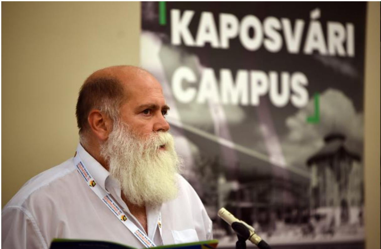
Szekcióülés levezető elnöke