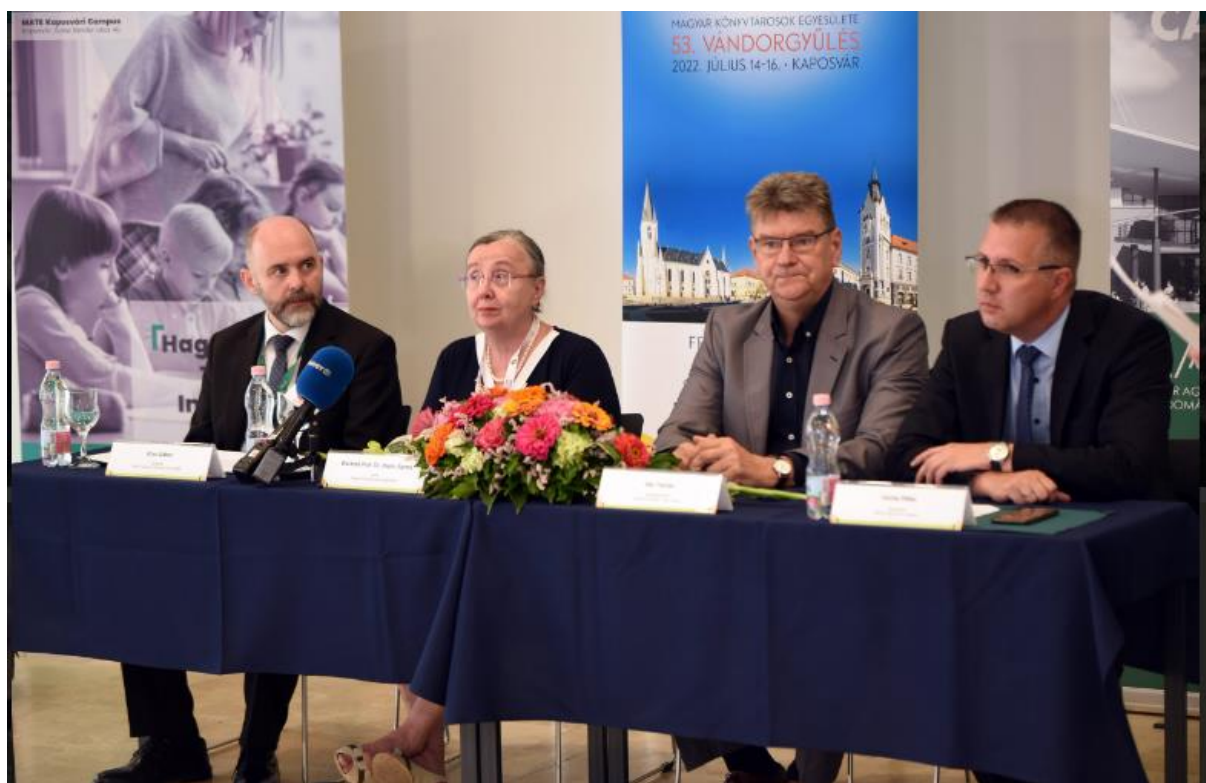
A plenáris ülés elnökségi asztala