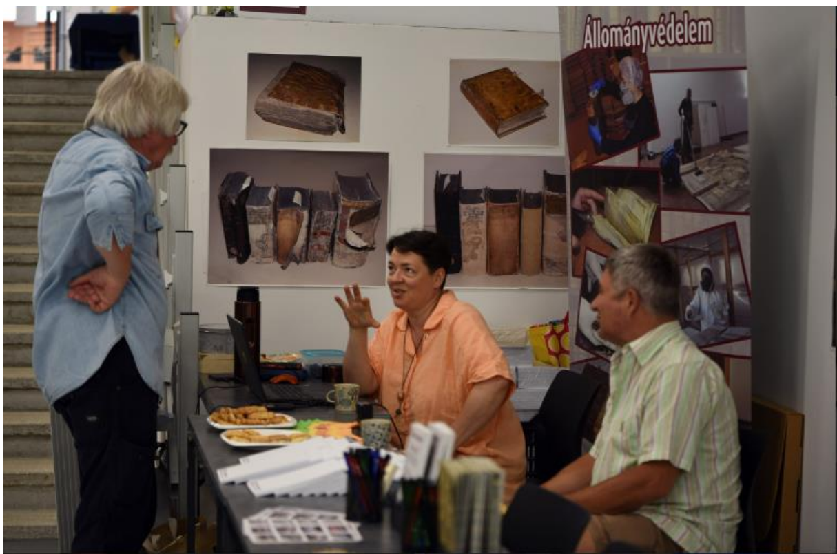
Szakmai kiállítási pillanatkép