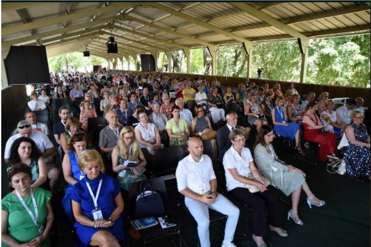
A plenáris ülés hallgatósága