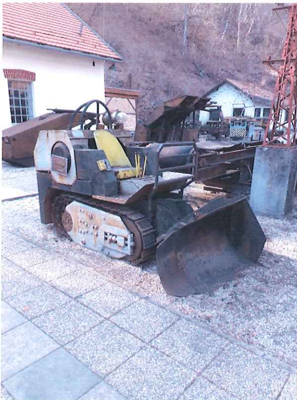
EHOR rakodógép felújítás előtt