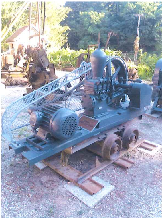
Felújított Mazalán zagyszivattyú