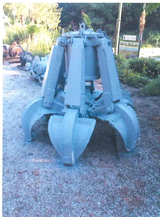
Felújított markoló gép