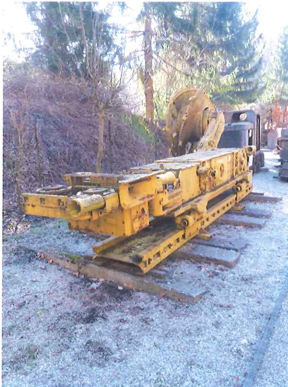
EW 130L maróhenger felújítás előtt