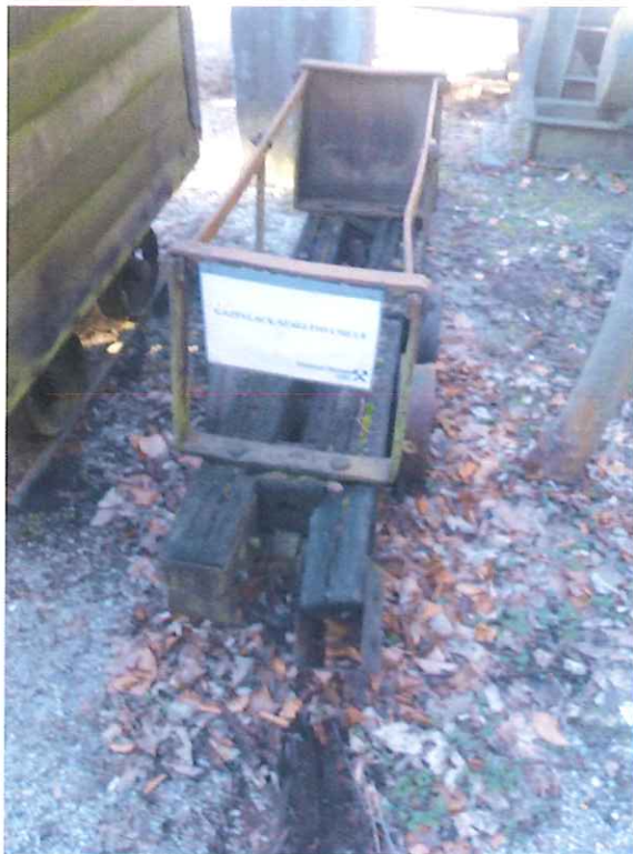
Fa alvázú palackszállító csille felújítás előtt