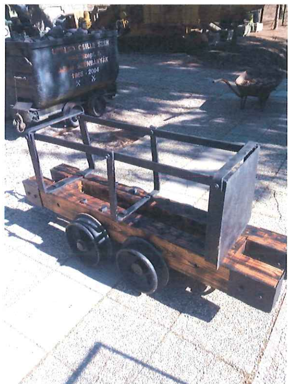
Felújított palackszállító csille