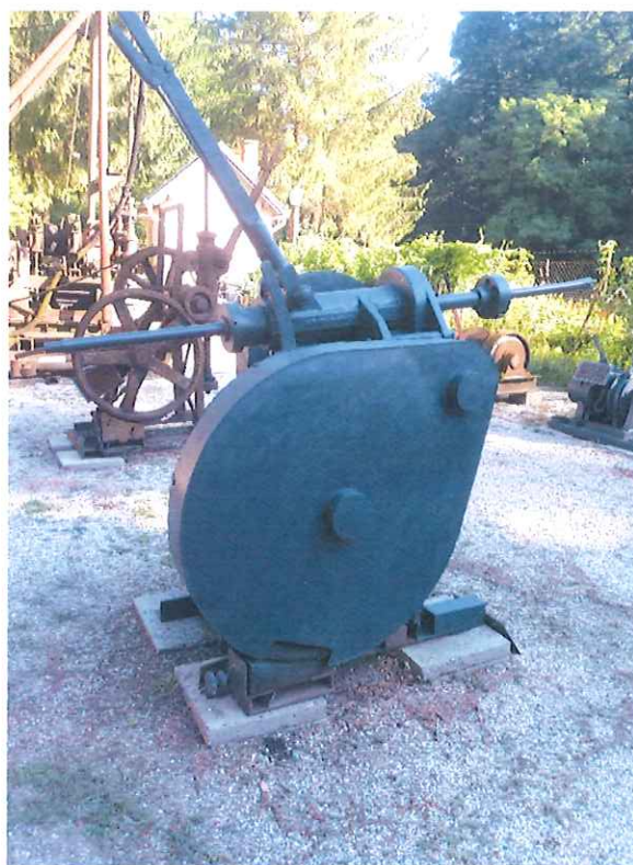
Felújított Claerius fűrógép