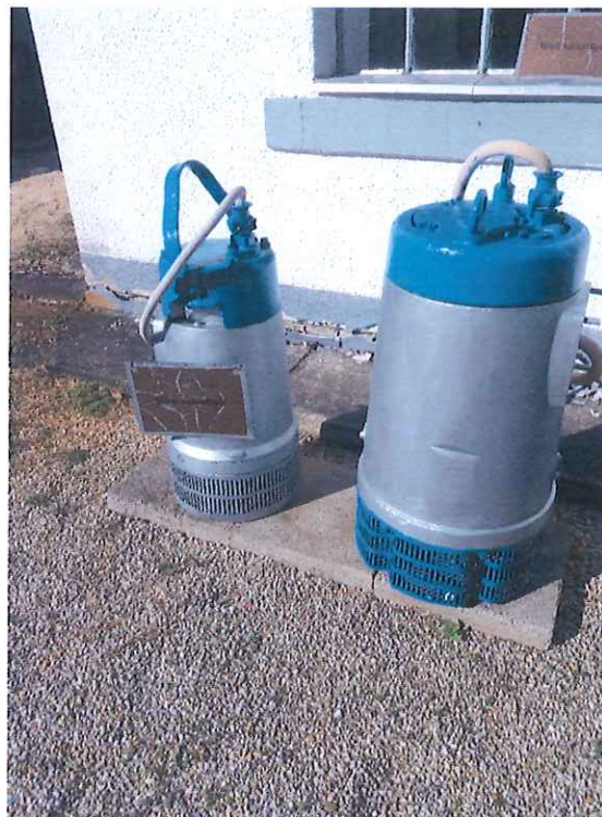
Felújított BIBO tip. szivattyúk