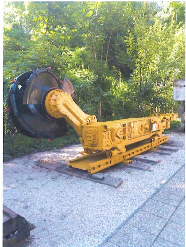
Felújított EWW 130L tip. maróhenger