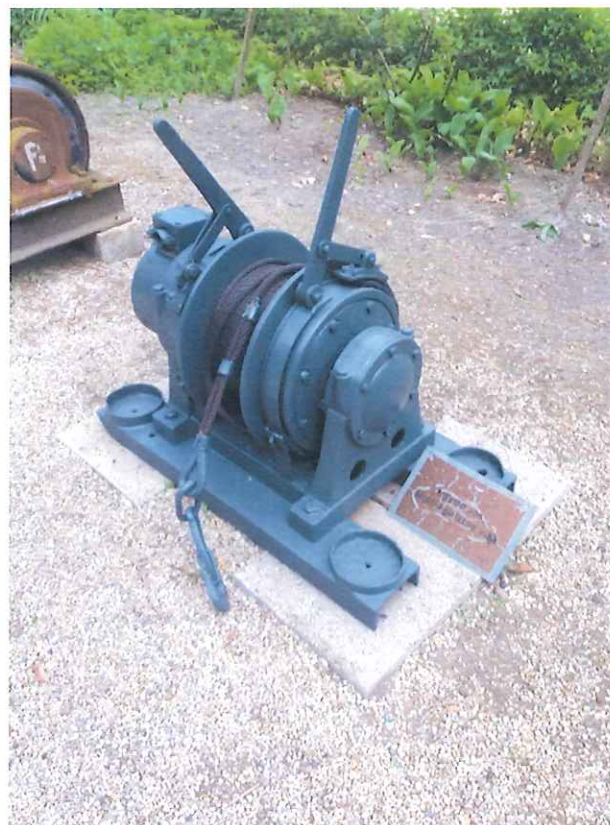
Felújított sujtólégbiztos vitla