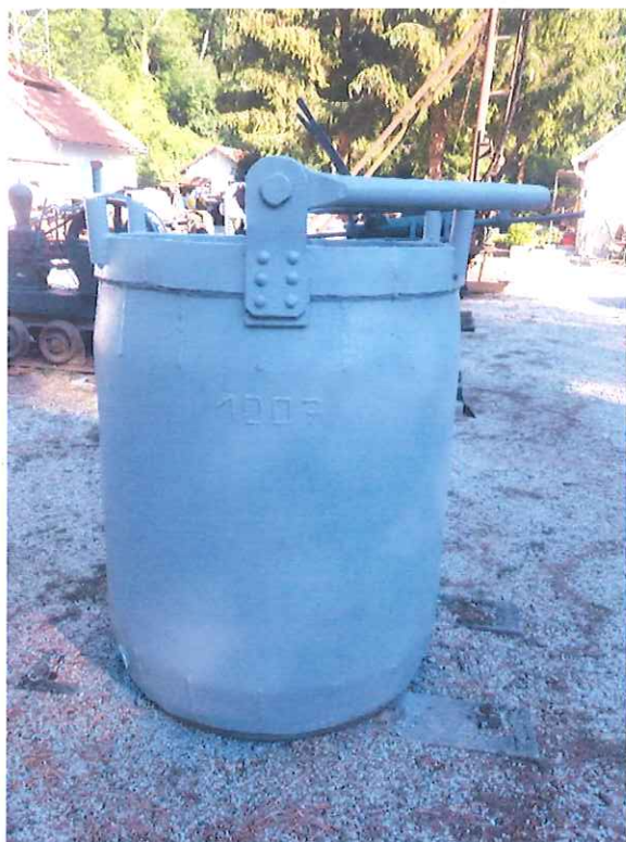
Felújított szállító bödön