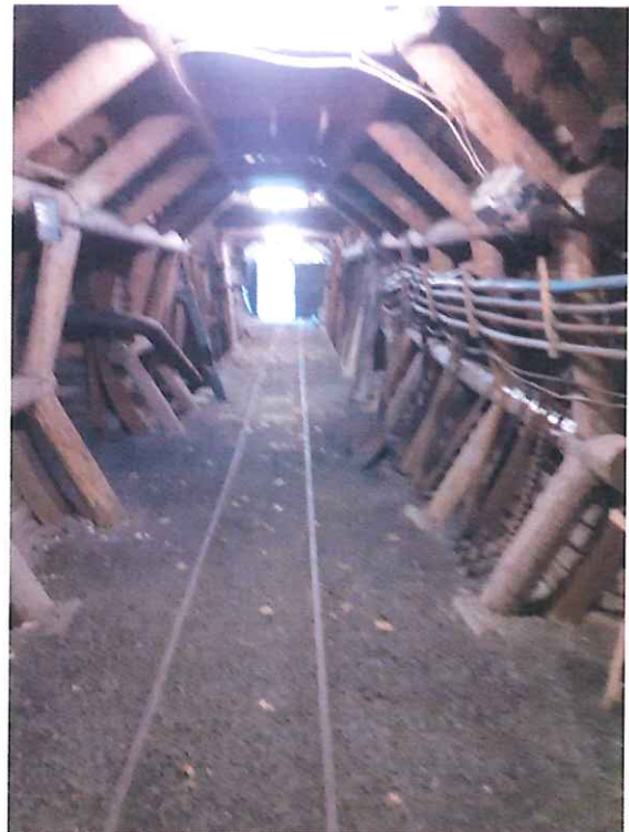
Bemutató táró kezelt szakasz