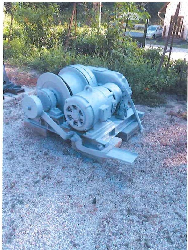
Felújított egydobos SB vitla