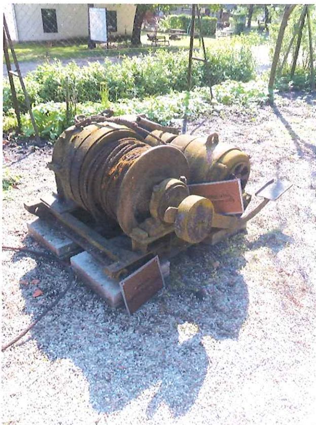
Egydobos SB vitla felújítás előtt