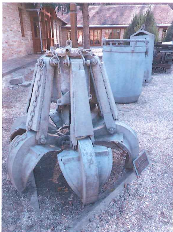
Markológép, szállító bődön és idomkő harang felújítás előtt