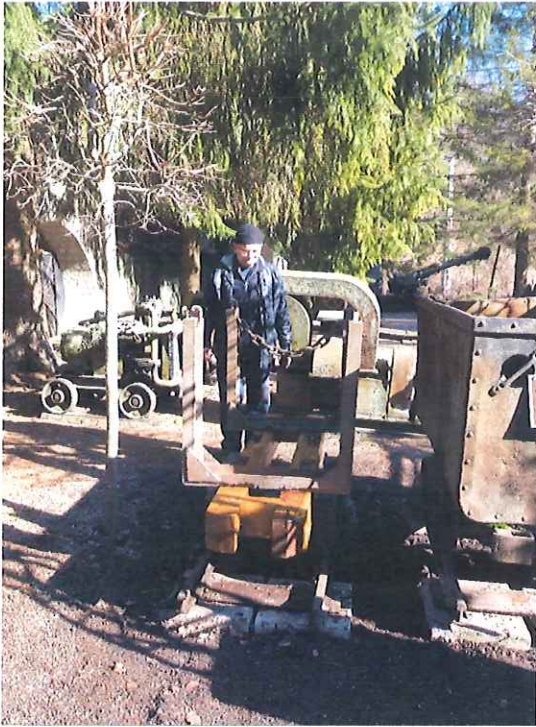
Fa alvázú szarvas csille munka alatt