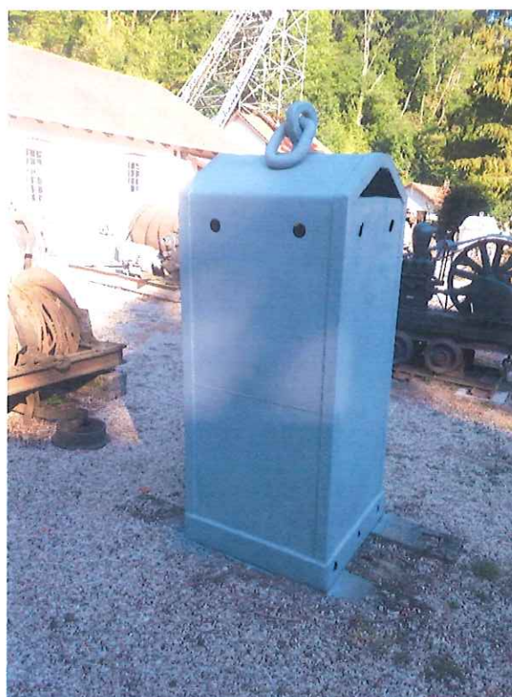
Felújított idomkő szállító harang