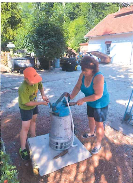
BIBO tip. szivattyú felújítás alatt