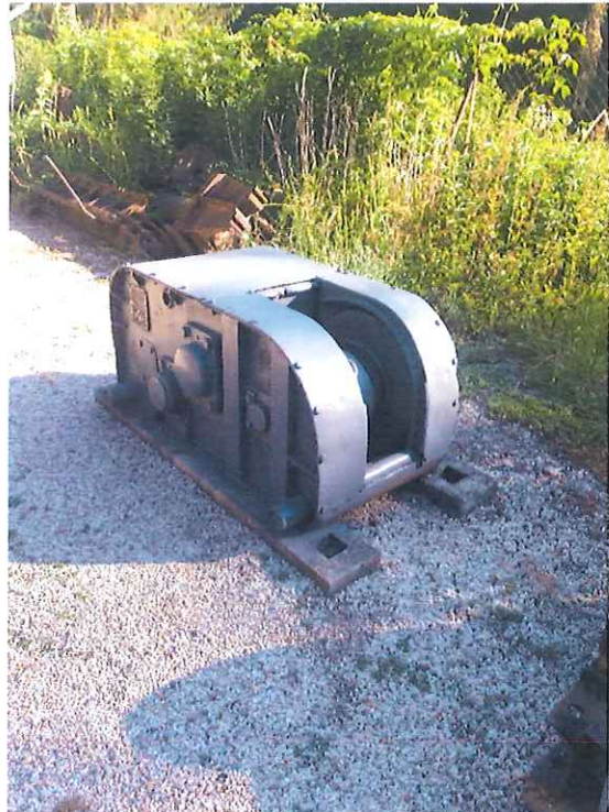
Felújított BÁTI farabló vitla