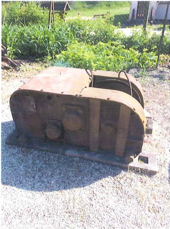
BÁTI farabló vitla felújítás előtt