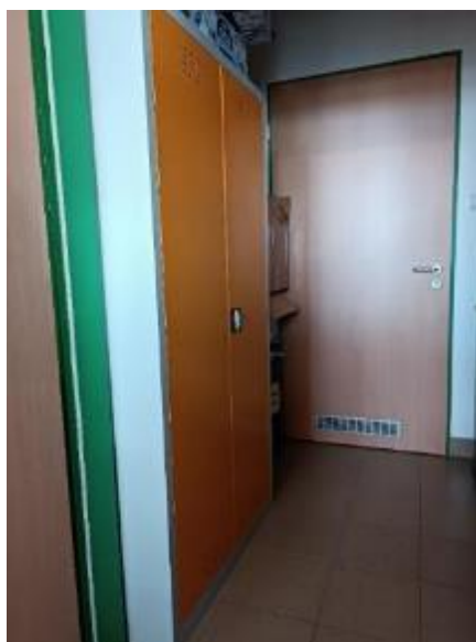
A raktárban elhelyezett korszerű fémszekrény

A munkánk során használt vegyszerek biztonságos, munkavédelmi előírásoknak megfelelő tárolása érdekében beszereztünk egy korszerű, zárható vegszerszekrényt.