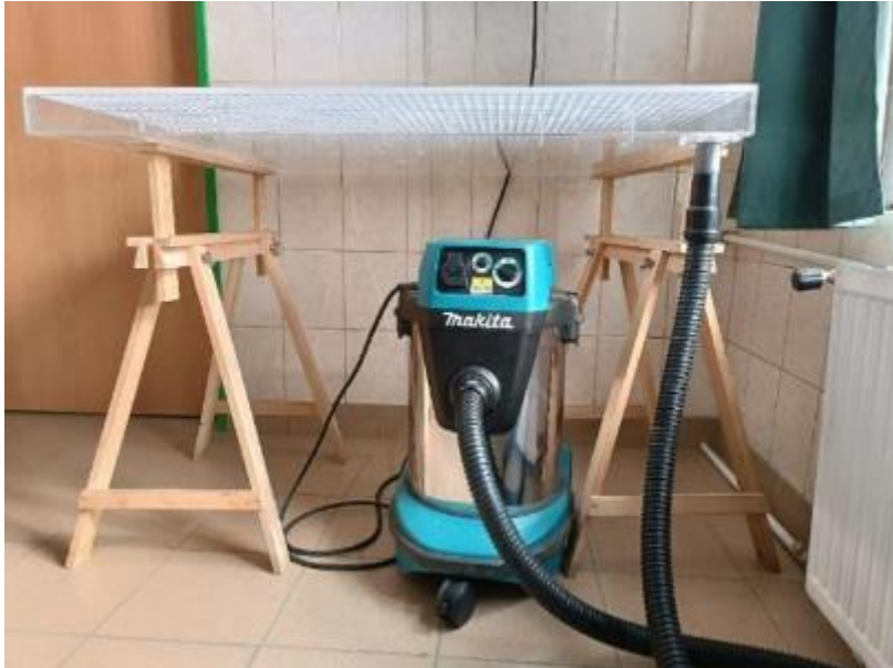
Az öntőasztalhoz csatlakoztatott vizes porszívó

Az öntőasztal lelke egy nedves porszívó melynek szívóerejével a körbemaszkolt műtárgyak hiányait könnyen és nem utolsó sorban esztétikusan ki lehet egészíteni. Az öntőasztalhoz csatlakoztatható vizes porszívóval szemben támasztott egyik legfontosabb követelmény a szabályozható teljesítmény, mert annak változtatásával beállíthatjuk a kiegészítés vastagságát, illetve speciális esetekben, vízre érzékeny dokumentumok (penésztől meggyengült, nedvességre levérző színező anyagok, vastagabb alátámasztó anyagra kasírozott vékony és gyenge anyagok stb.) kezelését (tisztítás, az alátámasztó papír lebontása stb.) is elvégezhetjük.