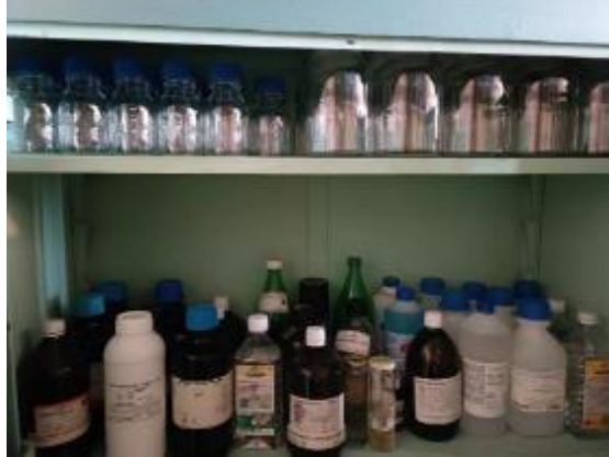
A felső polcon sorakoznak a jelenleg még üresen álló labor- és porüvegek

A restaurálás szerteágazó folyamatai során sokféle vegyszert, oldószert, ragasztót, anyagot, festéket használunk melyek tárolását szeretnénk az előírásoknak megfelelően 1 és jól átláthatóan megoldani. A pályázati pénzből beszerzett 60 db 250 ml-es Boro laborüveg kiöntőgyűrűvel és csavaros kék GL 45 kupakkal, 20 db 1000 ml-es raktári porüveg biztosítja a vegyszerek szakszerű tárolását.