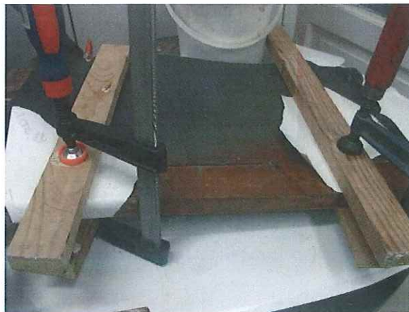
Középső láb hiányának pótlása

Statikailag indokolt helyeken, mint a keretbetétes szerkezet nútjai, a függőleges elválasztó-tartó elemek csapolása, az erősen károsodott részek (pl. lábvégek) pótlása az eredeti anyaggal megegyező, előkezelt fenyőfával, lapolással, csapolással, ragasztással történt.