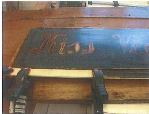
Betétek konzerválása, kiegészítése