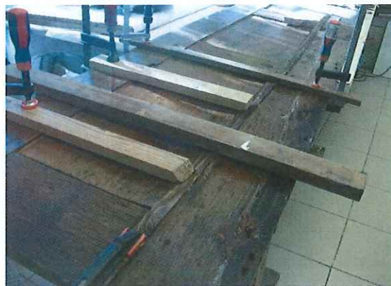
Konzervált, kiegészített betétek visszahelyezése