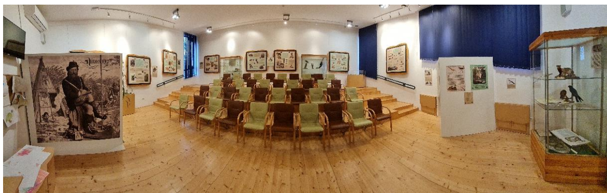
1. ábra: A kiállítótér elrendezése