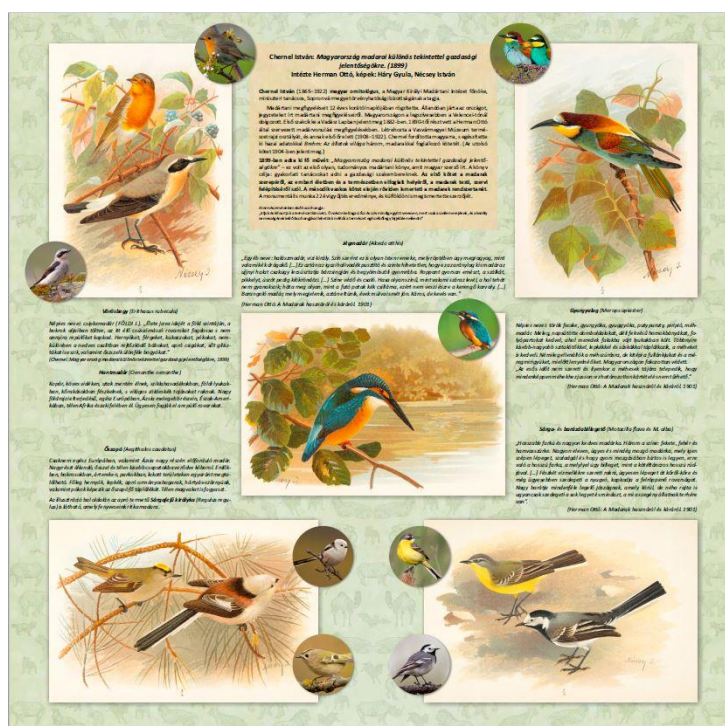
2. ábra: Az információs táblák arculata