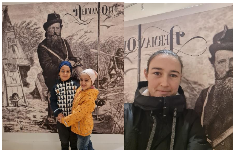
7. ábra: Herman Ottót ábrázoló fotópont