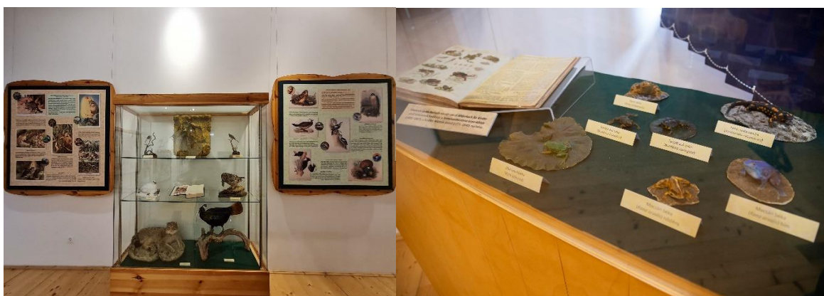
3. ábra: A bemutatott tárgyak elrendezése