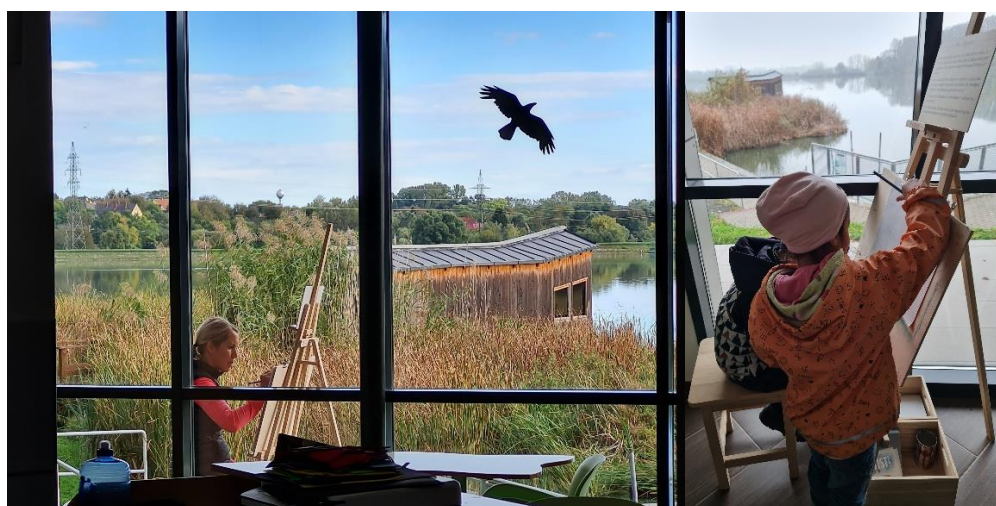
8. ábra: Kultéri alkotósarok