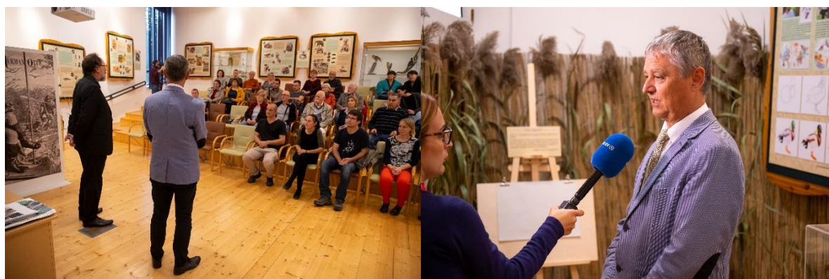
9. ábra: A kiállítás megnyitója 2022. szeptember 29-én