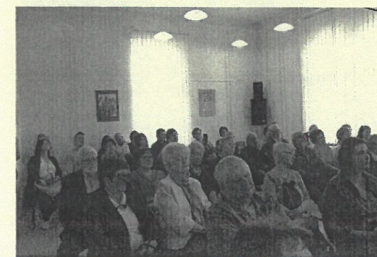
második nap műhelymunka és előadás résztvevői