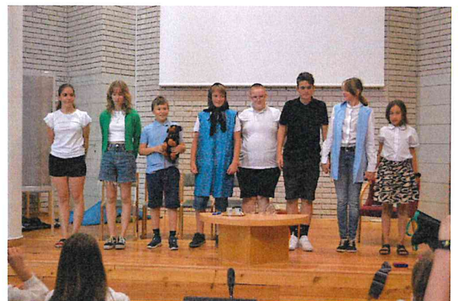
Kedves napló! Beszámoló a záróünnepségen