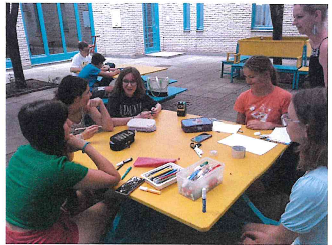
Munka közben a Gézengúzok és a Képirók