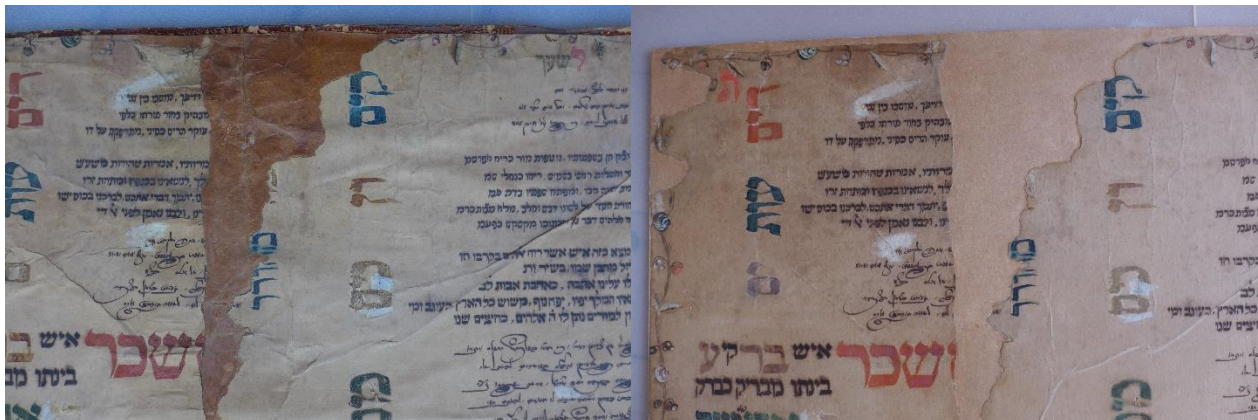
A tárgy részlete restaurálás előtt és után