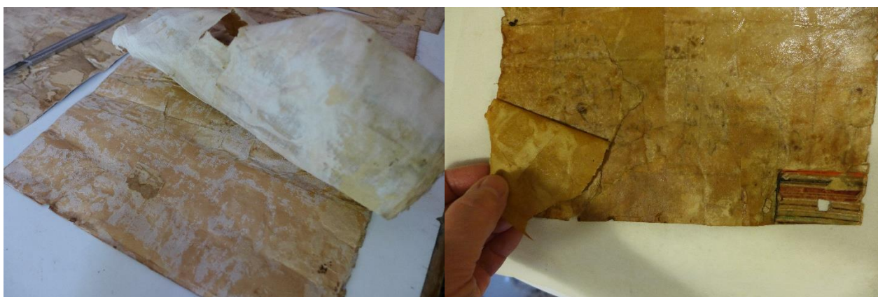
A hátsó kasírozások bontása szárazon és nedvesen