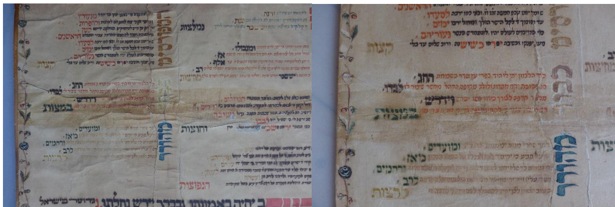
Gyűrött, szennyezett részlet restaurálás előtt és után