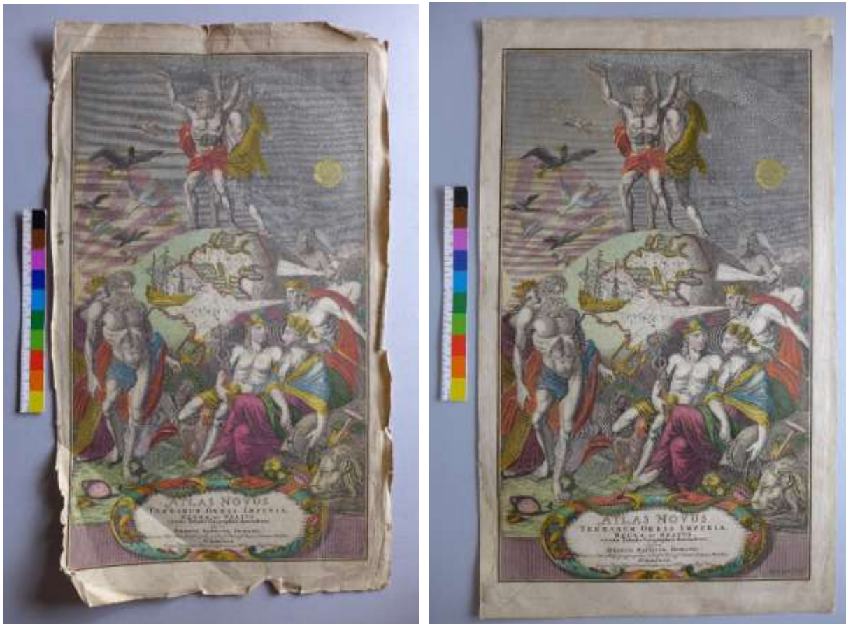
A címlap restaurálás előtt és után

A restaurált dokumentumok: Homann, Johannes Baptist: Atlas Novus. – Nürnberg, 1716-tól, 46 db térkép (hiányos) és címlap, jelzete: T.359., 16 db rézmetszettel készített térképlap és 1db címlap. A térképek mérete kb. 62x55cm, a címlap mérete 54,5x32,2 cm.