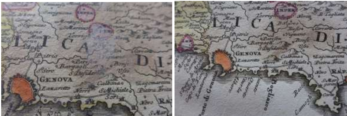
Fehéres penészpórák a 32. térkép felszínén a restaurálás előtt és a megtisztult terület a munka végeztével

A lapszélek szennyezettek , porosak, néhol sáros üledékkel, hajtásokkal, gyűrődésekkel, szakadásokkal. A felületeket penész eredetű, áttetsző, finom fehéres por fedi. A címlap hátoldalán fölül madárürülék nyomai, a folt a színoldalra is áttért.