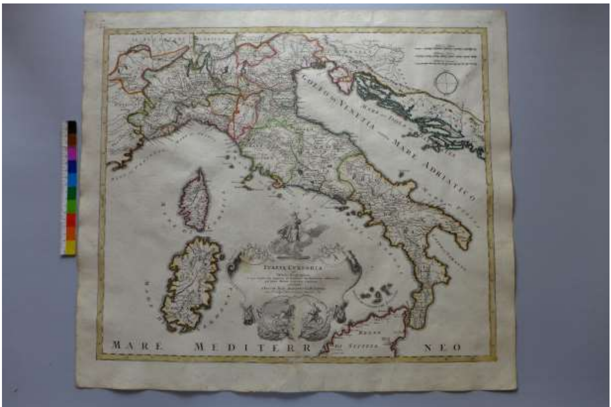
A 20. sorszámú térkép restaurálás előtt és után