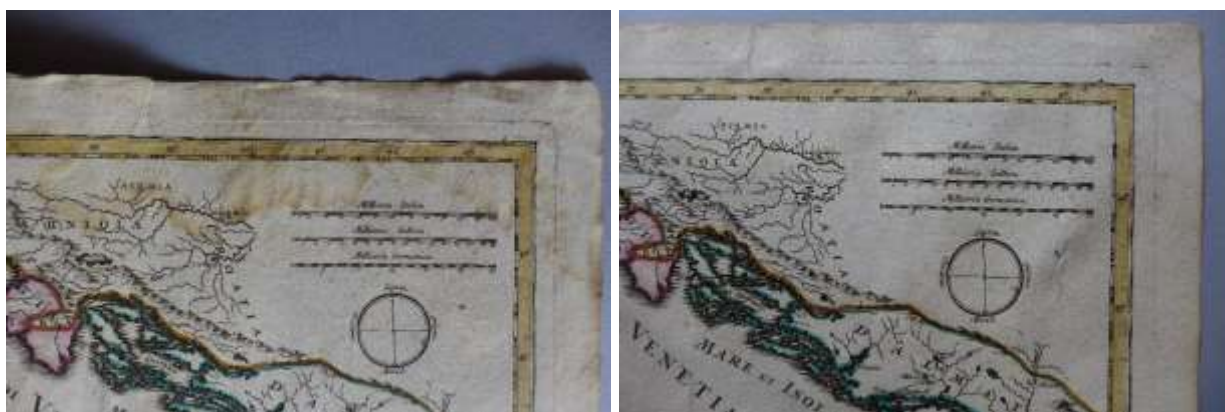
A 20. sorszámú térképen levő vízfolt részlete restaurálás előtt és után

A térképek állapota: A dokumentumok rézmetszettel készített, utólag kifestett térképek, egy rézmetszettel készült címlap és egy nyomtatott regiszter. A hosszában félbehajtott térképlapokat egykor a hajtáshoz ragasztott papírcsíkkal fűzhatték kötétté. A ragasztás nyomai, ill. néhol a papírcsík maradványai is megtalálhatóak a hátoldalakon. A kötés