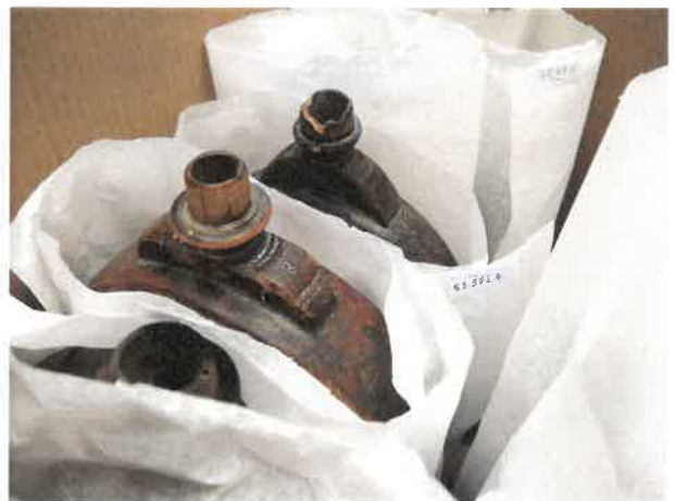
Kartondobozok és savmentes papír