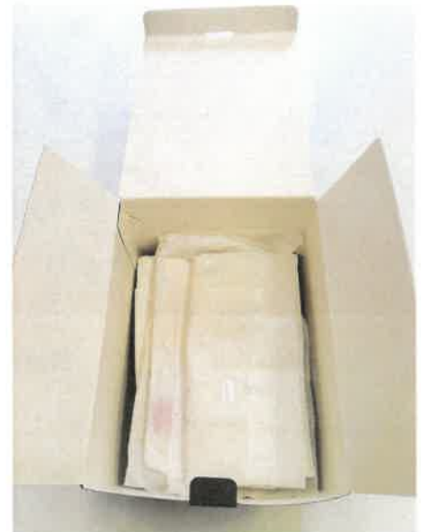
Savmentes dobozok és savmentes papír