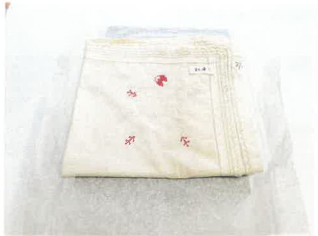
Savmentes papír és savmentes dobozok