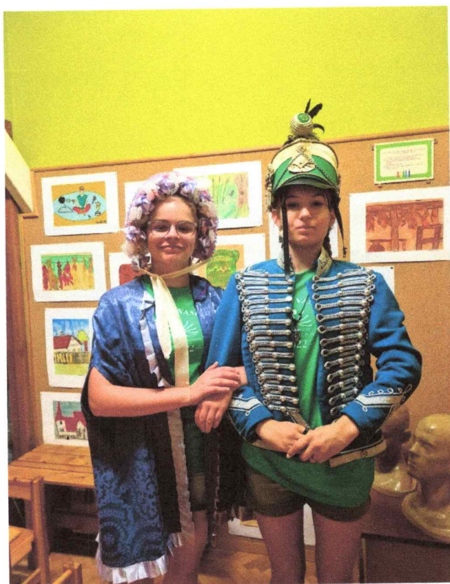
Beöltözés a múzeumban