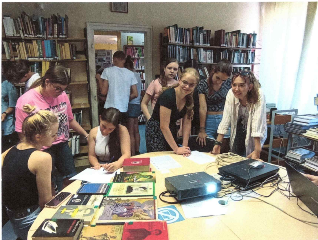
Petőfi 200 – vetélkedő- helytörténeti különgyűjtemény