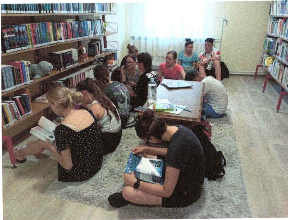
Az ODÚ-ban a klubtagokra várva