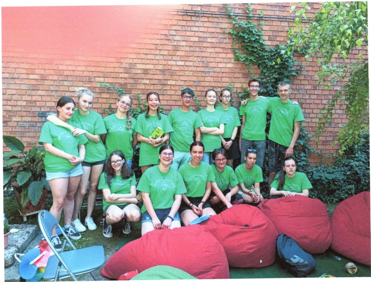
A csapat- mindjárt indul a felfedezőútúra