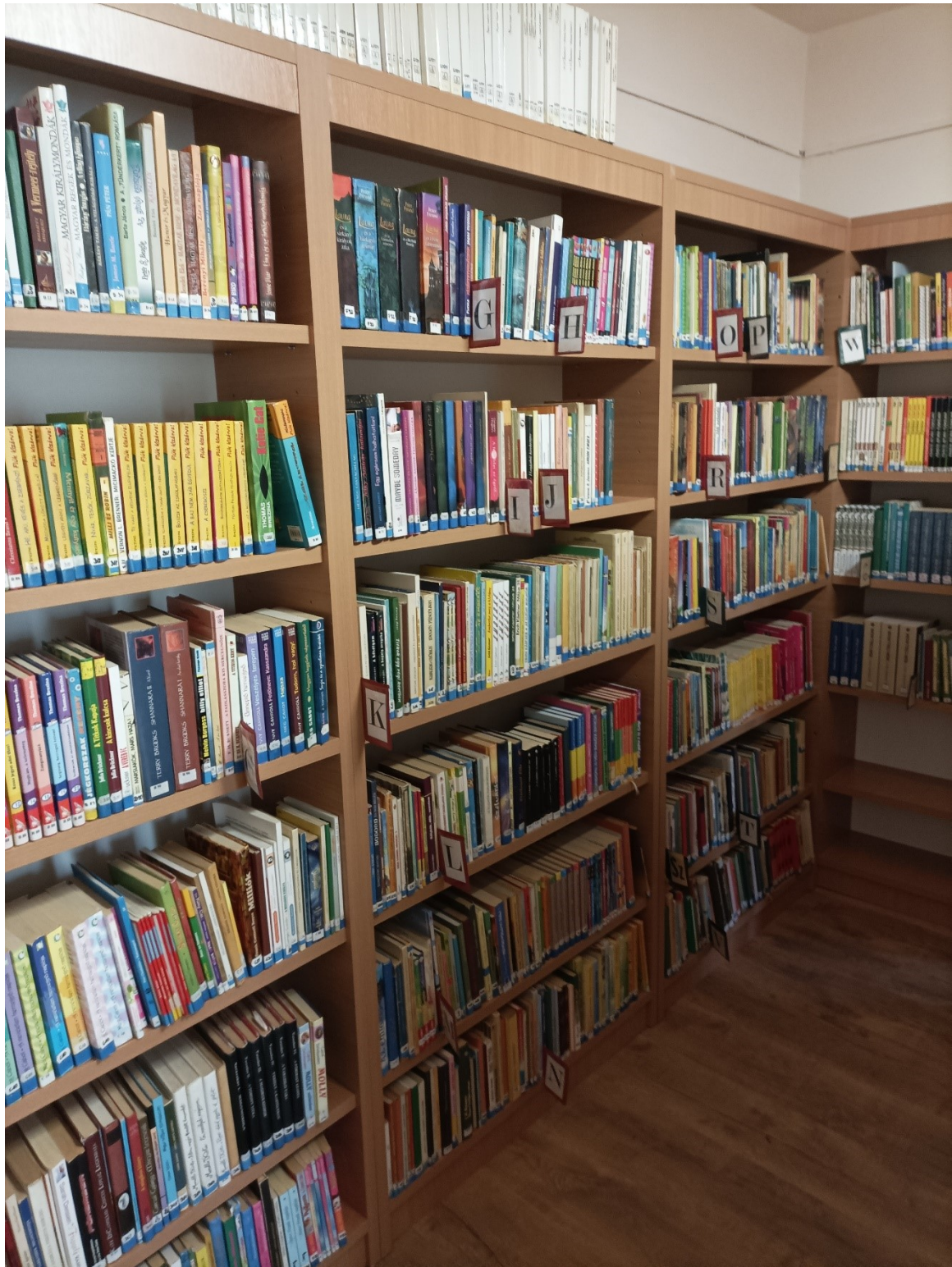
Új magas polcok berendezve