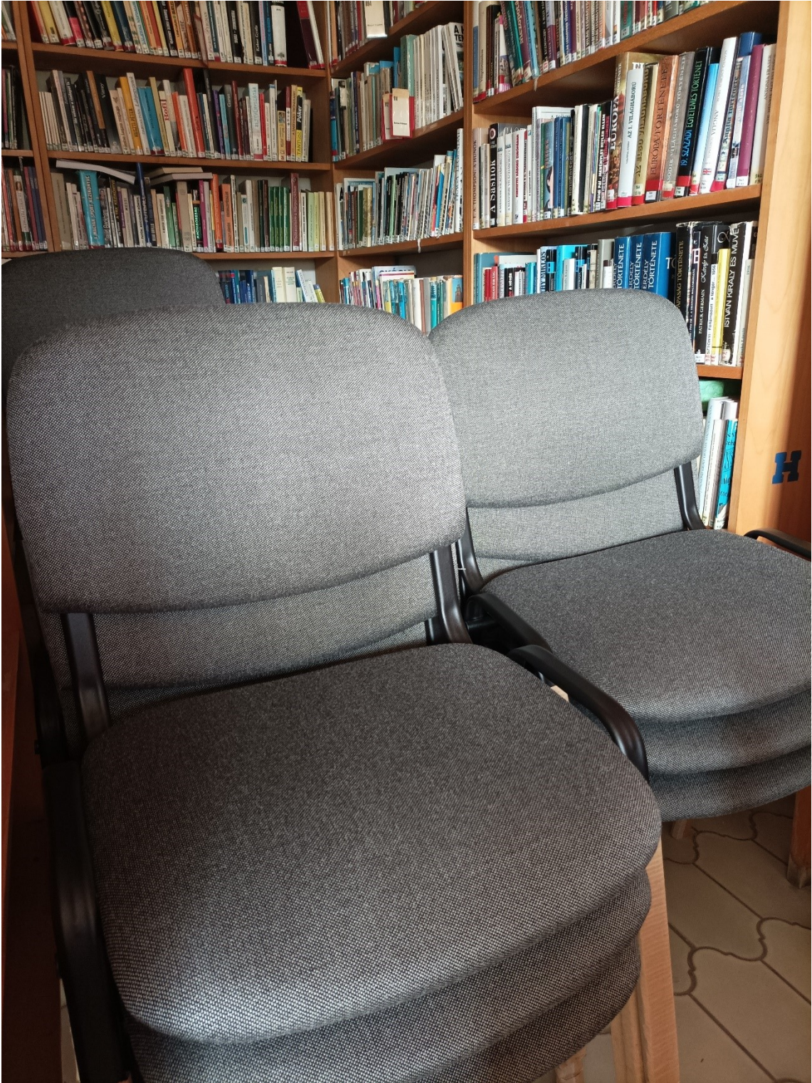
Beszerzésre került rakásolható székek