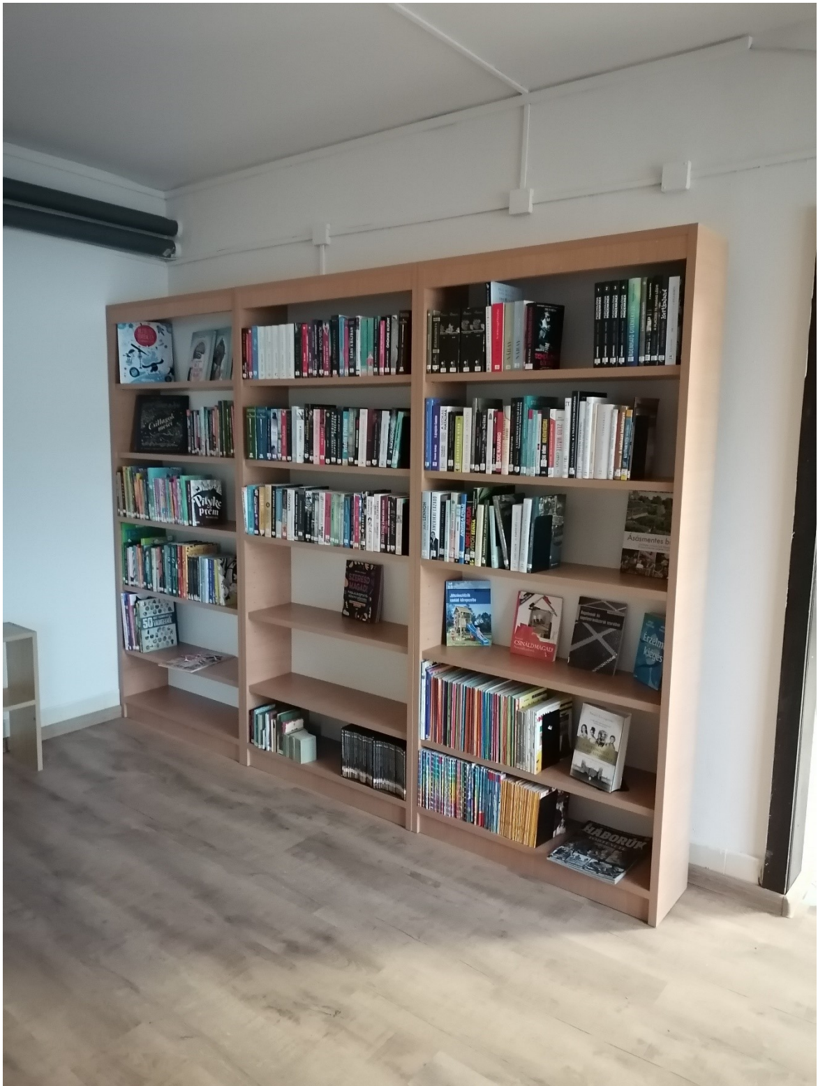
Új magas polcok berendezés alatt