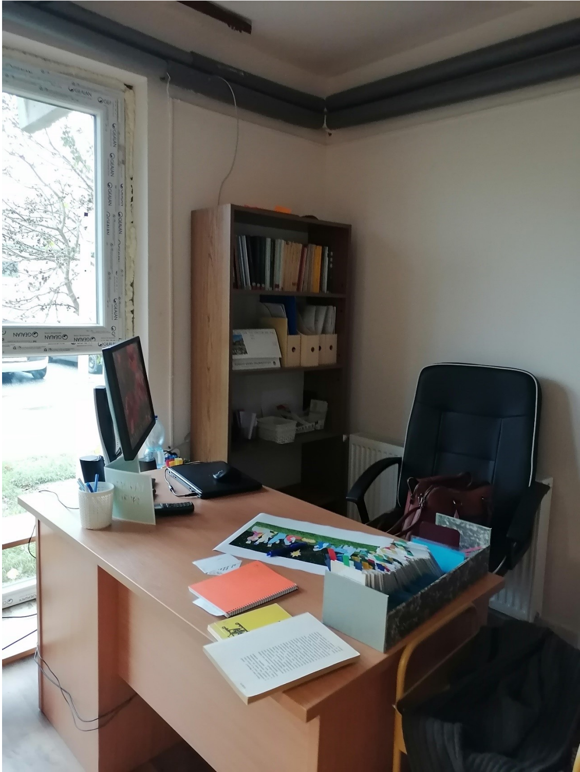
Új íróasztal, forgószékkal