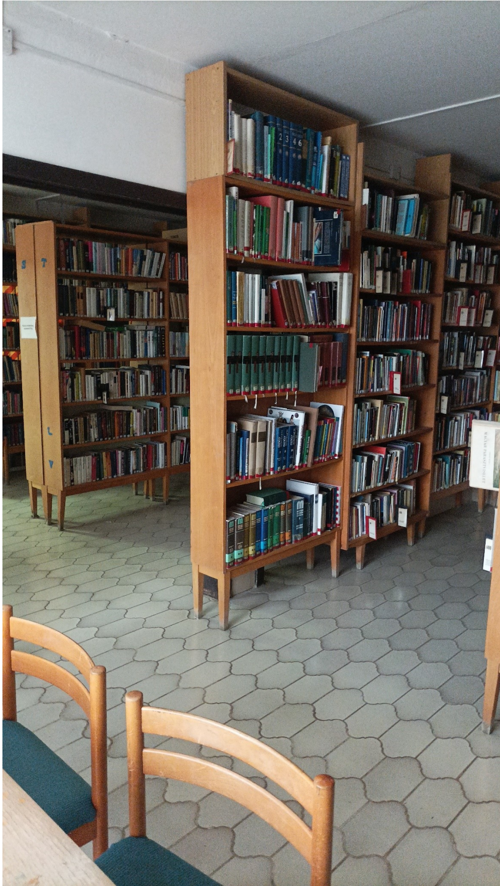
Régi polcok, székek