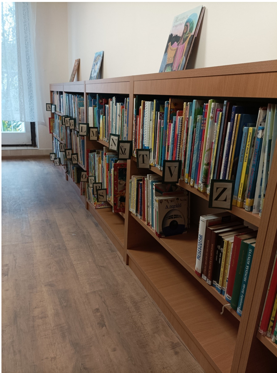
Új alacsony gyermek polcok