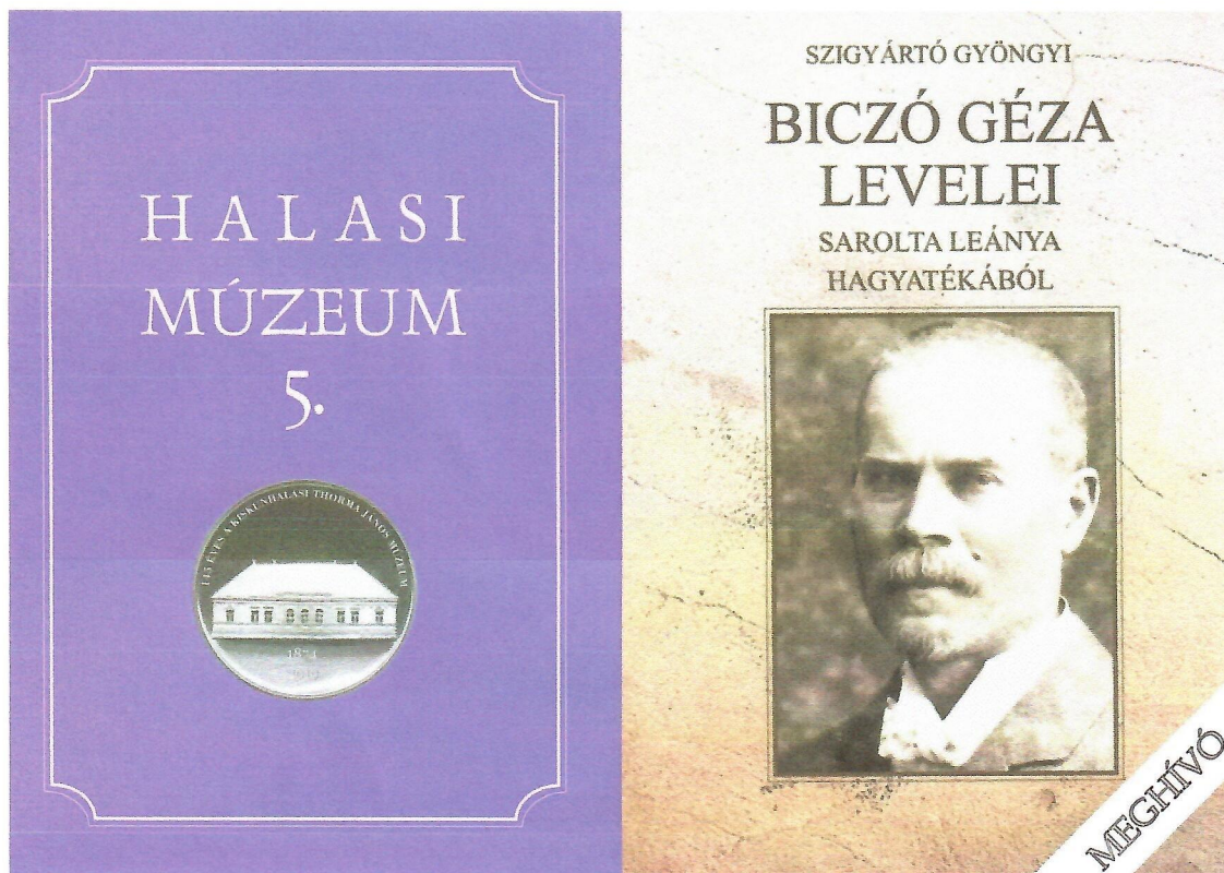
2. kép: A könyvbemutató meghívója