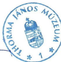
Szakál Aurél múzeumigazgató

A handwritten signature in blue ink, appearing to read 'Szakál Aurél', is written over a circular blue stamp.