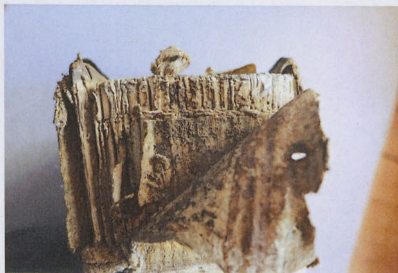
Pergamen gerinckasírozás a borítóbőr alatt

A könyvtestet hat dupla zsinegbordára fűzték. A hátsó nyílásban három borda eltört. A fűzés az első/utolsó íveknél meggyengült , az ívek kijárnak, a könyvtest enyhén deformálódott. Oromszegője csak lábnál maradt meg, vászon alapra gyöngyhímzéssel készült. Az alap végeit a táblák külsejére rögzítették.