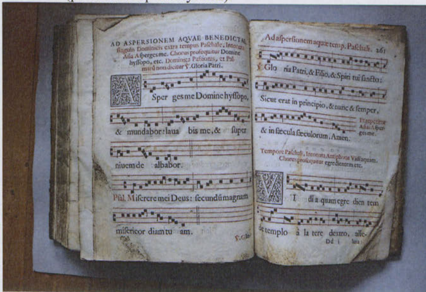
Oldalpárok tisztítás előtt és után

A könyvtest: Vastag merített papírra feketével és pirossal nyomtatott kötet. A levélpárok két lapból vannak gerincnél összeragasztva, kis ráhajtással. A későbbiekben sok lapszéli javítás történt különböző merített papírokkal. A ragasztáshoz használt keményítő miatt a pótlásokon néhol rovarkár nyomai láthatóak. Több lapon kiterjedt légy piszok szennyeződés van, jellemzően inkább a hátsó íveknél. A lapok többsége zsíros ujjnyomos , felületük finom porréteggel fedett. A méretek miatt a papír néhol megtört, meggyűrődött, a gyűrődésekben töredezik (pl. a 206. lap környékén).