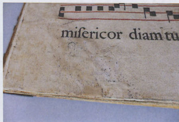
Légyiszkos lapszél tisztítás előtt és után

A könyvtestet hat dupla zsinegbordára fűzték. A hátsó nyílásban három borda eltört. A fűzés az első/utolsó íveknél meggyengült , az ívek kijárnak, a könyvtest enyhén deformálódott. Oromszegője csak lábnál maradt meg, vászon alapra gyöngyhímzéssel készült. Az alap végeit a táblák külsejére rögzítették.