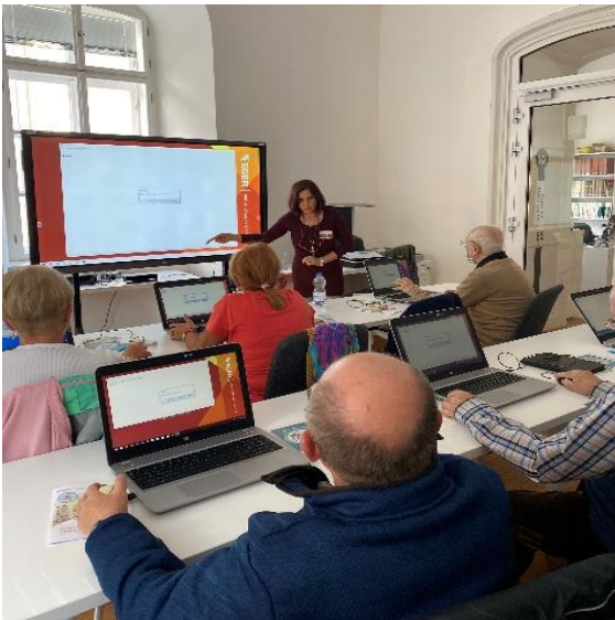
NetHelp informatikai foglalkozás időseknek