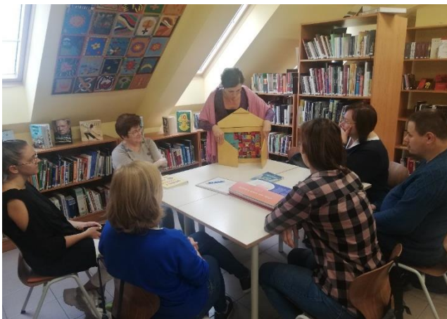
"Így mesélj, hogy olvasson"