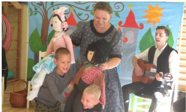
Zagyvaszántó Paramisi Társulat