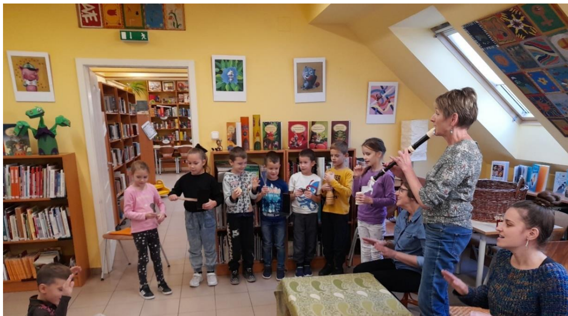
Mesefoglalkozás a Gyermekkönyvtárban