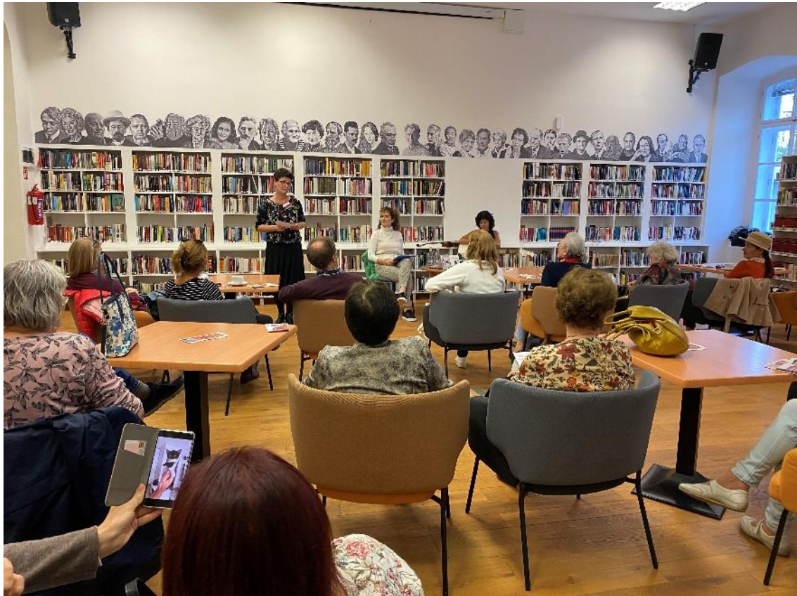
Diéta forte női utak, stációk zenés irodalmi est