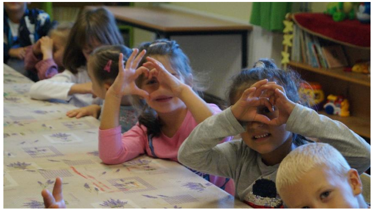
Gyöngyöspata - Puszimesék -