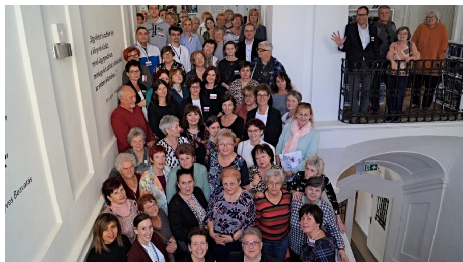
70 éves a Bródy Sándor Megyei és Városi Könyvtár