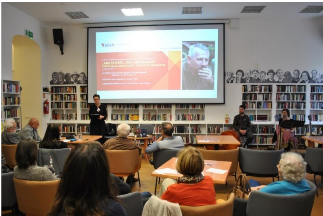
"Ami szívből jön, megmarad" című zenés-irodalmi est