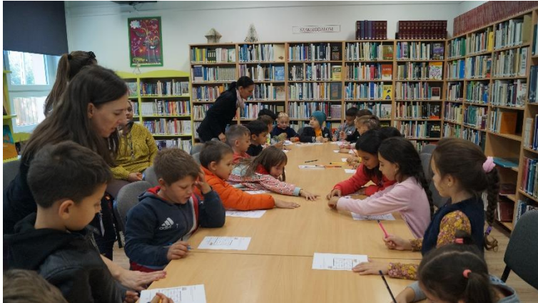
Kömlő „Most csak én segíthetek!”