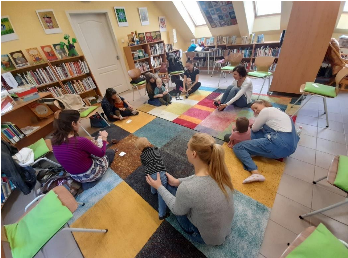
Ciróka - mondóka, zene, móka, tánc, játék