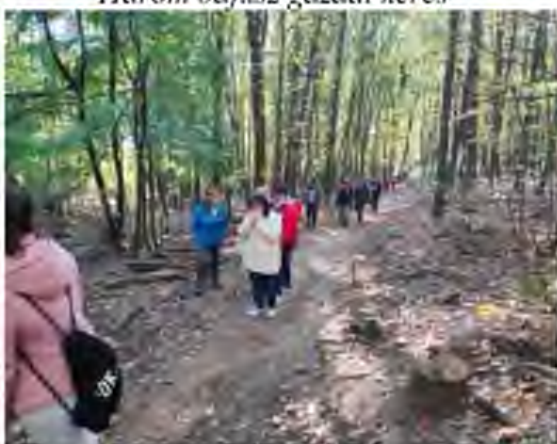
Lépések az egészségért