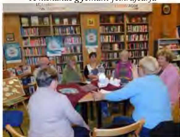
Forgách-i Fiókkönyvtár – 60 felett is ...