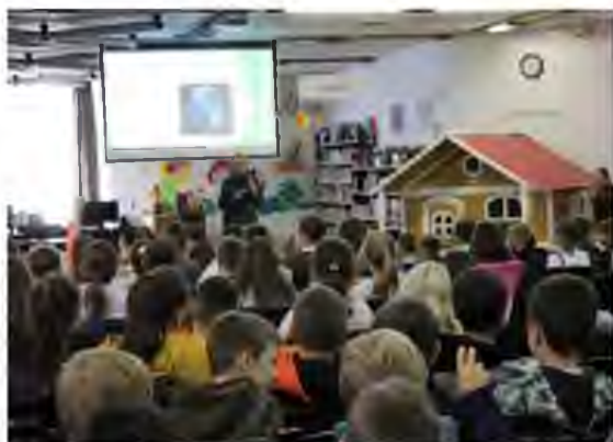
Állati jó Bolygó - előadás