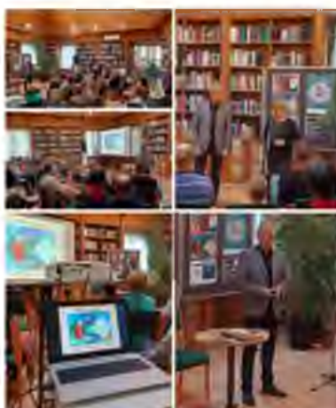
Nagy Árpád előadása