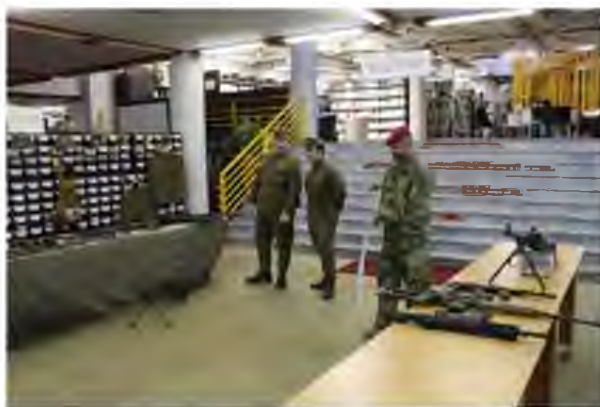
Hagyományörzés és honvédelem