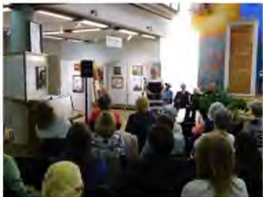
Petőfi S. nyomában... kiállítás megnyitó