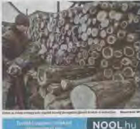
A szociális tüzelőanyagok...