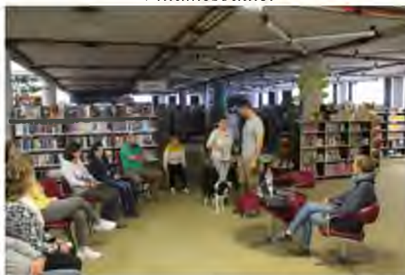
Emberek és ebek ... - előadás