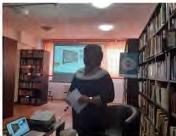
Molnár Éva előadása