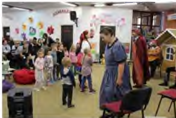
A kiskakas gyémánt félkrajcárja