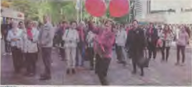
BALÓTTARJÁN A mellrák elleni harc jegyében. Végvár magasról címvel hívott ki a Magyar Mellrákellenes Liga Salgótarjáni Alapszervezete és a Nógrád Megyei Könyvtár a 'Leküzdhető a betegség!' című akciót. A rendezvény egy már hagyományossá vált a könyvtárról a Fő térig, ahol a szervezők ismertették a mellrák elleni világnap üzenetét. Ezt követően kihirdették az országos felhívást, majd egy flashmobot is tartottak. A szövegértés és a szövegalkotás feladatait is megvalósították a résztvevők.