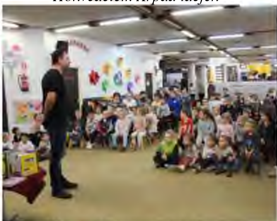
Három bajusz gazdát keres