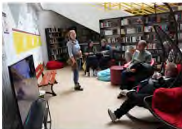
Kitárul a világ – Adj esélyt!