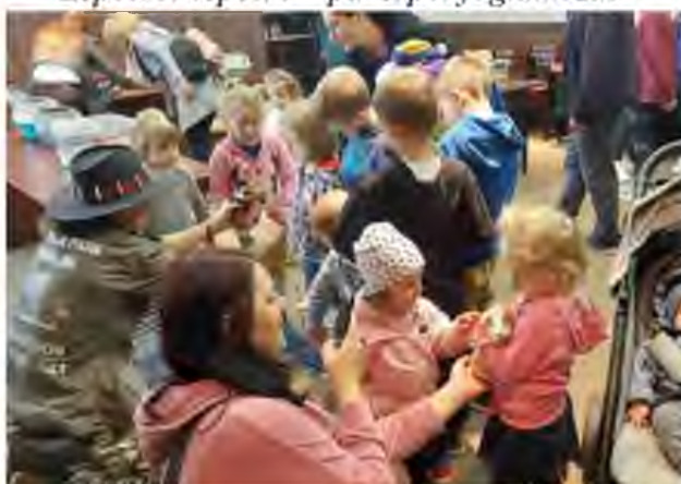
Állati jó délelőtt a Frenklin Park ...