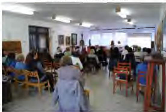
Autizmus szülői szemmel