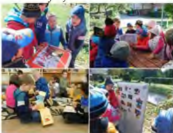
Zagyvarónai Fiókkönyvtár – Meseösvény