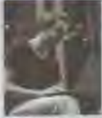
Sokaknak a helyi lakosok a tüzelőanyagot szállítják.

Sokaknak a helyi lakosok a tüzelőanyagot szállítják. A Balassi Bálint Megyei Könyvtárban tartottak egy tájékoztató ülést a szociális tüzelőanyagokról. A rendezvényen a helyi lakosok a tüzelőanyagokról és a szociális tüzelőanyagokról is tájékozódhattak. A rendezvényen a helyi lakosok a tüzelőanyagokról és a szociális tüzelőanyagokról is tájékozódhattak.