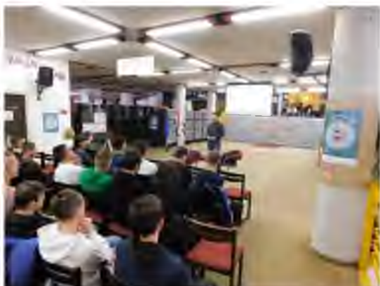
Honvédelem Árpád idején