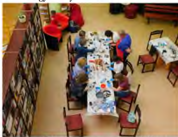
Lépésről-lépésre – páverpol foglalkozás