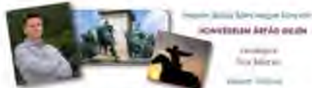
Helyszín: Balassi Megyei Könyvtár „KONFERENCIA A FÉRFIAK ÉRTELMEZÉSÉNEK ÉRTELMEZÉSÉRE” Közlekedési és társadalmi integráció Készítette: Nagy Márton