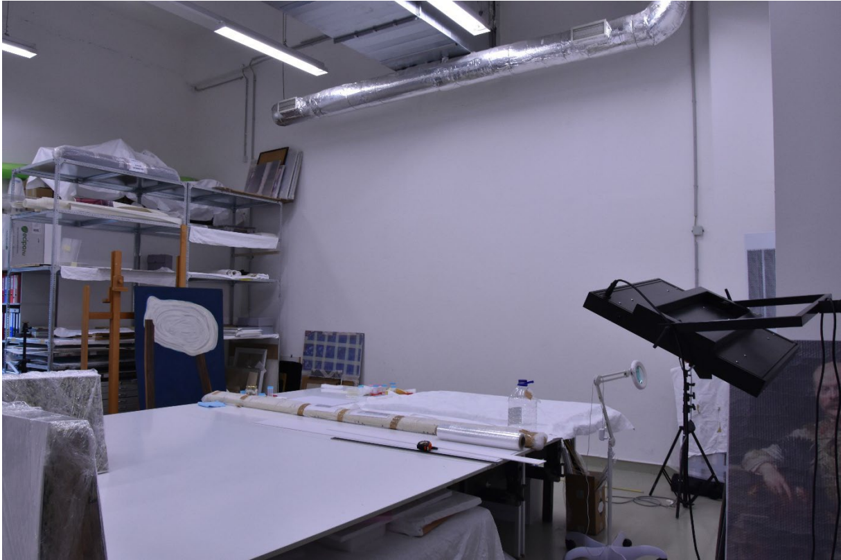
A Manipulációs tér üres fala a salgó polc beszerelése előtt

A Manipulációs térben az új salgó polc segítségével jobban ki tudjuk használni a rendelkezésre álló helyet, a polcokon az időszaki kiállításokon szereplő művek csomagolóanyagait, illetve a restaurálásra váró műveket tároljuk.