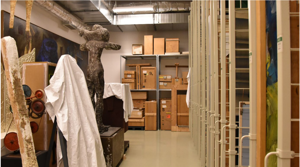
A 4. műtárgyraktár a beszerelt salgó polccal

A salgó polc behelyezésével jobban ki tudjuk használni a helyet, az említett mű kevesebb helyet foglal a raktárban, így a tárgyak szükség esetén jobban mozgathatóak, illetve a magasra helyezett festményeket is el tudjuk érni targonca/emelőgép segítségével.