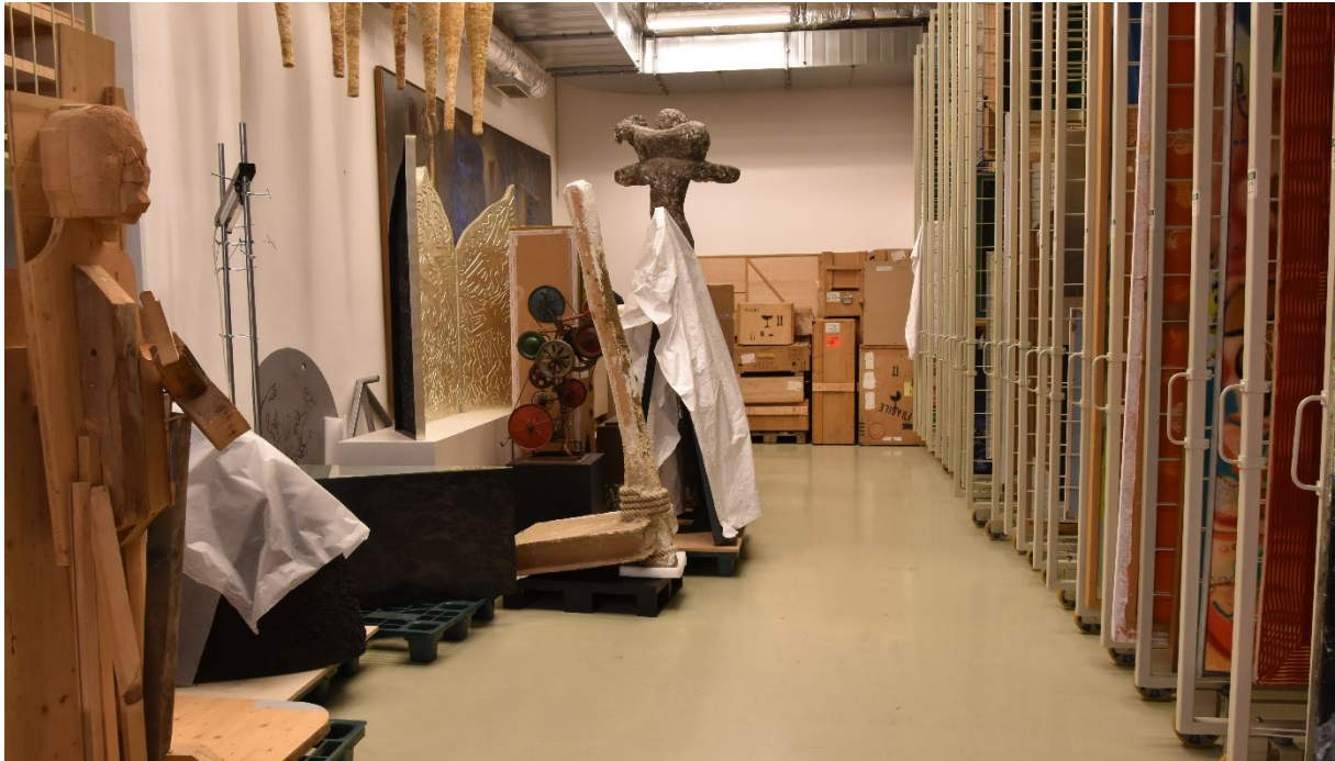
A 4. műtárgyraktár az átalakítás előtt

A 4. raktár hátsó részét teljes mértékben elfoglalták Leonyid Mihajlovics Baranov Puskinnak ajánlva című sokelemes installációjának ládái, így a leghátsó rácsokat, illetve a raktár sarkában található kiszögellést sem tudtuk megközelíteni, illetve használni.