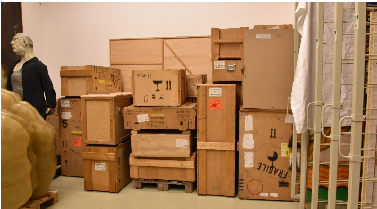
Leonyid Mihajlovics Baranov Puskinnak ajánlva című installációjának ládái