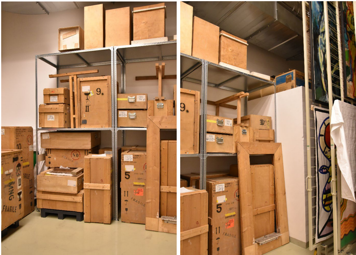
A polcnak köszönhetően hozzáférünk a raktár sarkában található kiszögellés tetejéhez, ami így rakodófelületként is szolgál