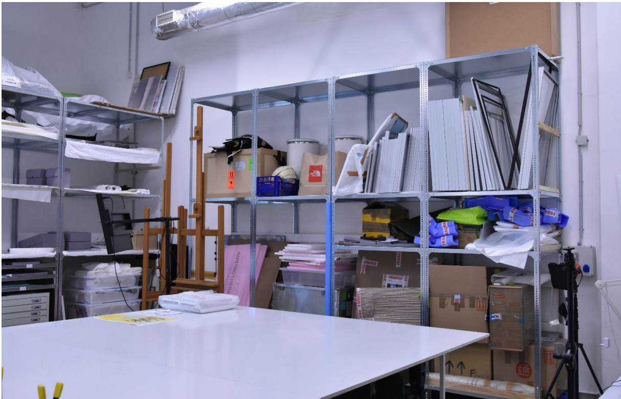
A polc beszerelése után