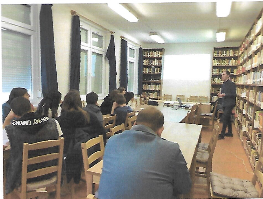
Készítette: Ács, 2022.