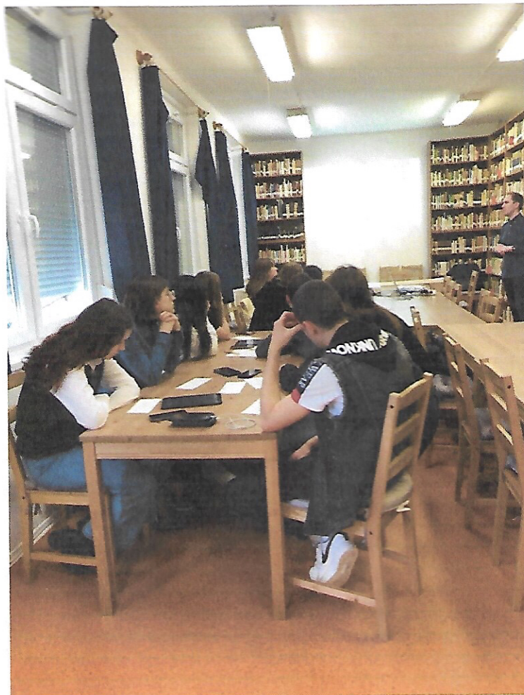
Készítette: Ács, 2022.