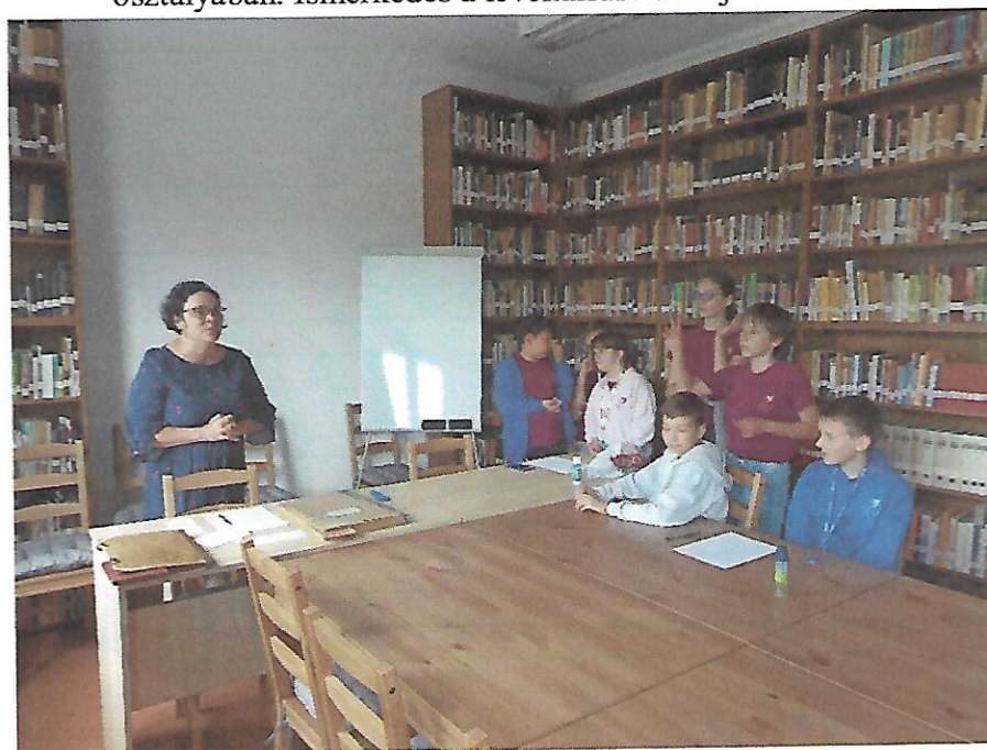
Készítette: Borbándi, 2022.