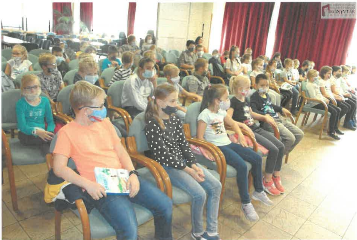
A Milli és Rémi kalandjai II. című kötet bemutatójának közönsége