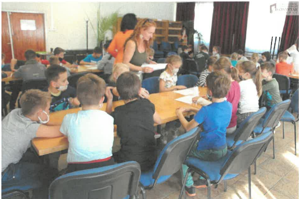
Kezdődik a kézműveskedés a kötetbemutató után