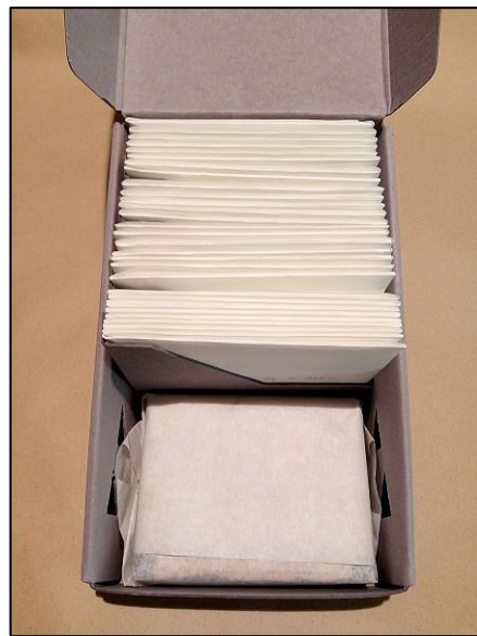
3. ábra. Savmentes dobozok és palliumok felhasználása Röntgen- és üvegnegatívak valamint kromotípa tárolására