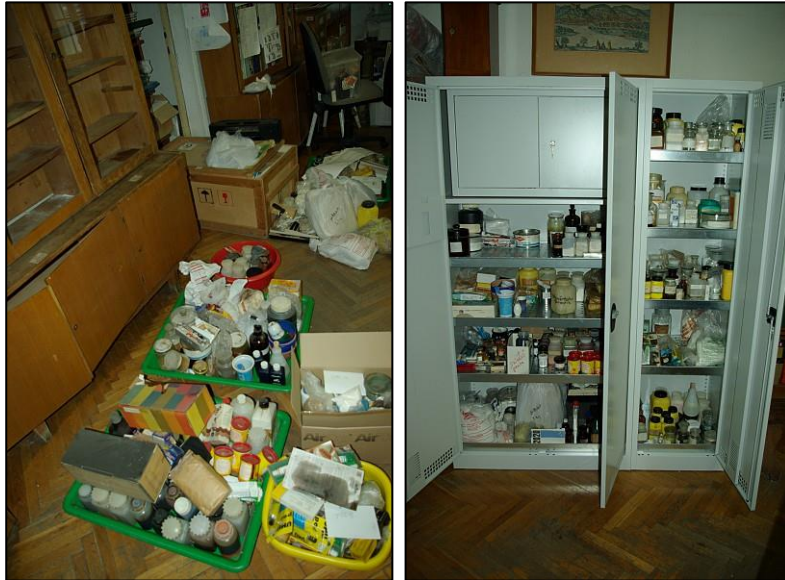
4. ábra. Vegyszerek átrendezése (régi és új állapot)

A pályázatban szereplő vegyszerszekrényeket a terveknek megfelelően meg tudtuk vásárolni, a vegyszerek átpakolása (és ezzel egyidejűleg a már használhatatlan vegyszerek selejtezése) megtörtént.