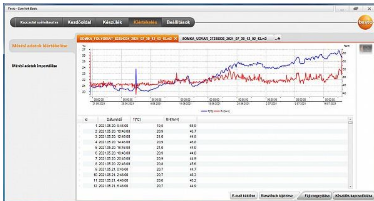
1. ábra. Az egyik mérési helyszín: SOMKA folyóiratraktár

Olyan mérőműszerek beszerzését terveztük, amelyek a folyamatos monitorozás mellett a begyűjtött adatokat tárolni (és alkalmas szoftver segítségével) elemezni is tudják. A 4 db testo 174 H mini adatgyűjtős műszer helyett 6 db-ot vásároltunk, ezek ui. azokon a helyszíneken is felhasználhatók voltak, ahová a gyenge Wifi jelerősség miatt (az eredeti tervekkel szemben) nem lett volna lehetséges Wifis adatgyűjtő kihelyezése. Ennek megfelelően csökkentettük a beszerzendő Wifis (160 TH) adatgyűjtők számát, a tervezett 5 db helyett végül csak 4 darabot vásároltunk. Összességében a tervezett 9 db mérőműszer helyett így 10 db műszerhez jutottunk, melyeket ki is helyeztünk a megfelelő helyszínekre.