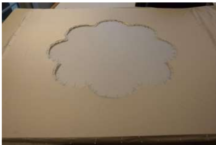
Az ideiglenesen tűkkel rögzített selyemszövet.