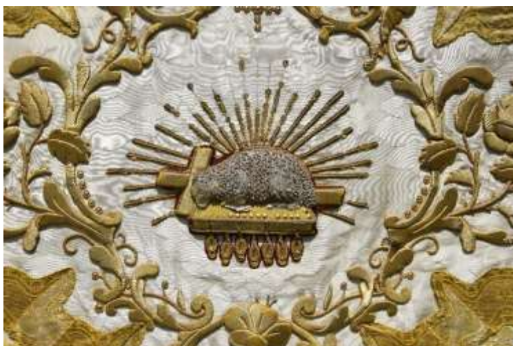
A bárány körüli flitterekből álló sugárkoszorú a konzerválás után.

A bárány körüli sugárkoszorú hiányzó flittereit nem pótoltam, a meglévők gyenge rögzítésű flitterek felvarrásának megerősítésére azonban szükség volt. Ezt sodratlan selyemszállal végeztem, ahol szükség volt rá a bouillon-okon is átöltve. Ez nagyban nehezítette a munkát, hiszen minden egyes öltéshez cserélni kellett a tűt – a rugó szerű bouillonokon csak vékony egyenes tűvel tudtam átölni, míg a flitterek levarrását csak görbetűvel lehetett elvégezni.