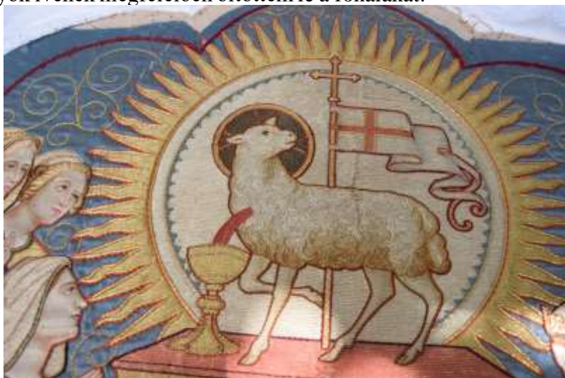
Sodratlan selyemfonallal levarrt egykor lebegő fémfonalak.

A lebegő fémfonalak rögzítését sodratlan selyemfonallal görbetű segítségével végeztem. A hímzett kép keretelését adó 3 db összefogott bordó színű zsinór rögzítése is több helyen meggyengült, elszakadt. Ezt az eredeti technikának megfelelően a zsinórokkal megegyező színű pamutcérnával végeztem, mindig a képre merőlegesen, a karélyok ívének megfelelően öltöttem le a fonalakat.