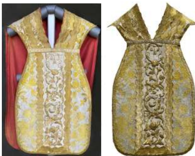
A miseruha előlapja a restaurálás előtt (balra) és után (jobbra).