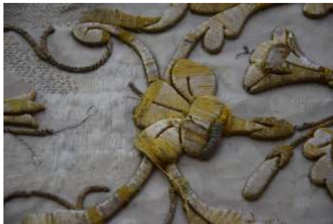
Az előlap középsávján pamutfonallal „retusált” virág – kiegészítés közben.

A bárány körüli sugárkoszorú hiányzó flittereit nem pótoltam, a meglévők gyenge rögzítésű flitterek felvarrásának megerősítésére azonban szükség volt. Ezt sodratlan selyemszállal végeztem, ahol szükség volt rá a bouillon-okon is átöltve. Ez nagyban nehezítette a munkát, hiszen minden egyes öltéshez cserélni kellett a tűt – a rugó szerű bouillonokon csak vékony egyenes tűvel tudtam átölni, míg a flitterek levarrását csak görbetűvel lehetett elvégezni.