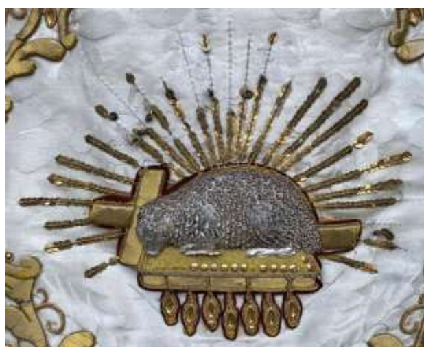
A bárányt körülölelő sugarak hiányos, lebegő flitterei.