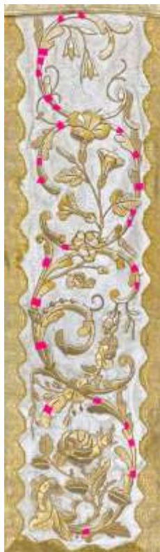
A miseruha előlapjának középsávja, az eltört hímzésalátöltés, rózsaszínnel jelölve.