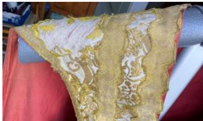
A miseruha vállán meggyengült, foszló szövet.