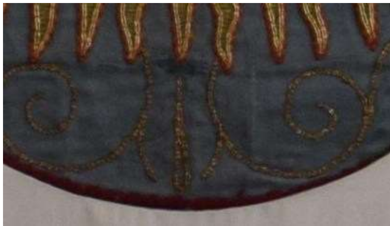
A különleges kiegészítési móddal konzervált lyuk.

A lebegő fémfonalak rögzítését sodratlan selyemfonallal görbetű segítségével végeztem. A hímzett kép keretelését adó 3 db összefogott bordó színű zsinór rögzítése is több helyen meggyengült, elszakadt. Ezt az eredeti technikának megfelelően a zsinórokkal megegyező színű pamutcérnával végeztem, mindig a képre merőlegesen, a karélyok ívének megfelelően öltöttem le a fonalakat.