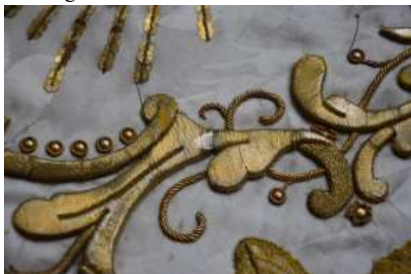
A félig a fémfonallas hímzés alá tolt fólia az eltört papír alátöltés felett.

Azokon a pontokon, ahol a hímzés alátöltése eltört és a fémfonalak ugyan épek, de a törésbe süllyedtek, a fémfonalak alá vékony műanyag lapot csúsztattam, áthidalásként, az alátöltés folytonossági hiányait megszüntetendő. Ezáltal a fémfonalak ismét eredeti síkjukba kerülhettek spatulákkal az eredeti sorrendjüknek megfelelően beigazgatva feltételezésünk – mely szerint hiányok nincsenek az eltört alátöltéseknél a fémfonalakban – beigazolódott.