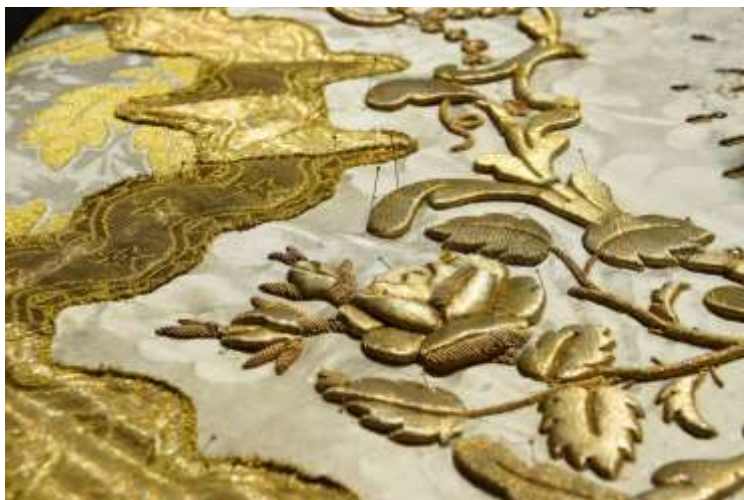
A száradás idejére a hímzés mentén rovartüvel rögzített szövet.

A száradás idejére a hímzett részek mentén, valamint a keretelő paszomány szélén rozsdamentes rovartüvel rögzítettem a szövetet.