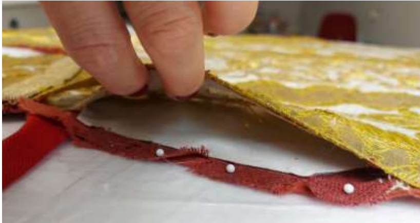
A rétegek közé illesztett alátámasztószövet.

A miseruha alapszövetének szakadásait, meggyengült részeit egy azzal megegyező textúrájú, alapanyagú, és azonos árnyalatúra színezett szövettel helyileg támasztottam alá. A különálló szövetdarabokat a hiányokon keresztül, illetve a szélek mentén felbontott paszományoknál keletkezett réseken csúsztattam az eredeti szövet alá, úgy, hogy a korábbi bélésként használt durva szövésű meggypiros vászon fölé egy műanyag lap került, hogy a munka során ne varrjam össze az eredetileg szeparált rétegeket egymással.