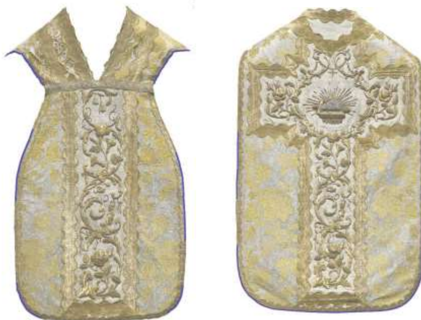
A miseruha bélésének és paszományának megbontott részeit kék színnel jelöltem a rajzon.

A tervezettel ellentétben a miseruha alapszövetének alátámasztásához szükséges volt néhány helyen megbontani a miseruhát. Ezt csak a legszükségesebb helyeken végeztem el.