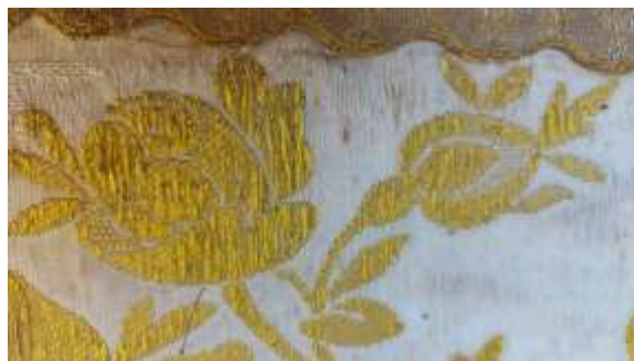
A miseruha oldalsávjainak lebegő brossírozó fonalait alátámasztás nélkül az ép alapszövethez rögzítettem sodratlan selyemfonallal.