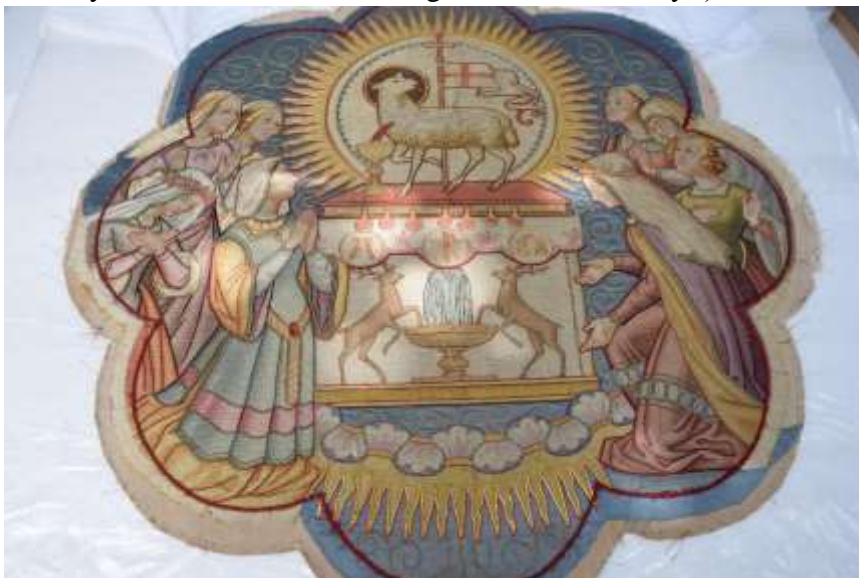
A párasítást követően a „száradás” idejére rovartűkkel megtűzött kép.

Szükséges volt a szövet szálainak rendezése, a szálirányok beállítása, hogy a gyűrődések kisimításával a további szakadások keletkezését is megakadályozzuk, az eredeti formáját visszaállítsuk. A képet egy lépésben, 2-3 órára egy pára kamrába, 90 % feletti relatív páratartalmú térbe helyezve a szövetszálak felpuhulnak annyira, hogy károsodás nélkül alakíthatóak legyenek. Miután ez megtörtént síkban kiterítve, fóliával bevont Hungarocell lapra tűztem ki a "száradás" idejére. (A fémfonallal sűrűn átvarrt textil esetében az üveglapokkal való lesúlyozás nem hozta volna meg a kívánt eredményt.)