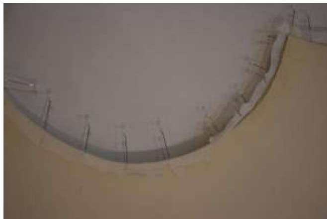
A finn karton íves kivágása mentén az ideiglenesen tűkkel rögzített selyemszövet.