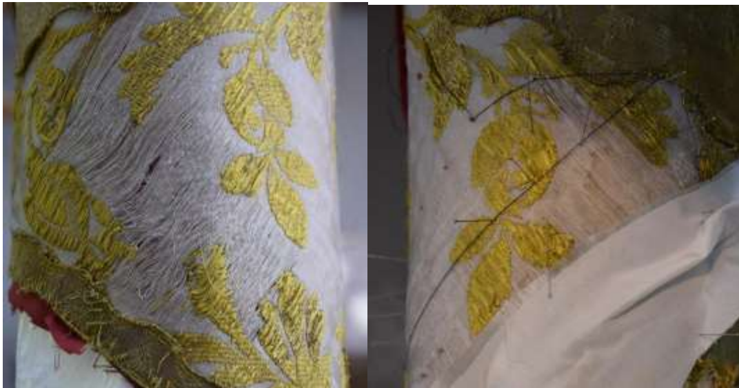
A meggyengült alapszövet a miseruha vállán a korábbi javítás eltávolítása után (bal oldalt), illetve a párasítás után a konzerválóöltés varrása közben segédcérnával (jobb oldalt).