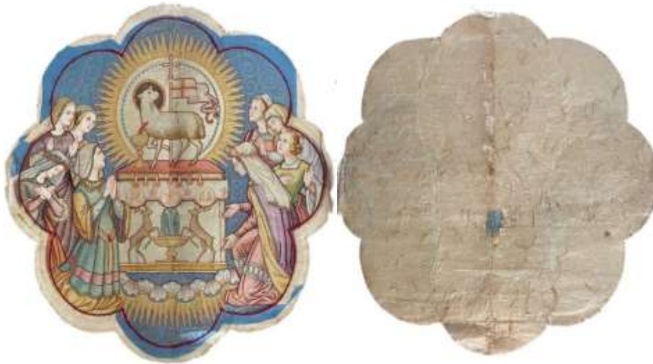
A hímezéstöredék elő- és hátlapja

LEÍRÁS: A nyolc karéjos formájú hímezéstöredék provenienciája ismeretlen. Mérete alapján valószínűnek tűnik, hogy egykor zászlóközép lehetett. A kép háttérét egy kékszínű atlasz- szövet adja. A díszítmény ettől szeparáltan készült, fektetve, a mintának megfelelően lazúrosan, színes fonalakkal letűzött fémfonalakból feltehetően géppel hímezve. A különböző mintaelemeket a kék “háttér-szövetre” tamburhímmel rögzítették. Mivel pusztán ez a szövetnem lett volna képes a díszítmény nagy súlyát megtartani, ezért egy egyszerű vásznat alkalmaztak merevítőbélésként. Feltételezhetően ezért kasírozták papírral a töredék hátoldalát is.