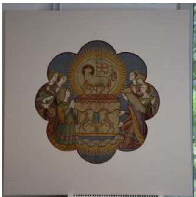
A restaurált kép a selyemmel bevont egyedi passzpartujában.