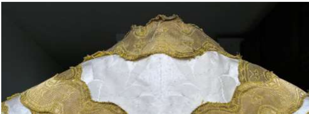
A miseruha nyakánál deformálódott, sérült paszomány.