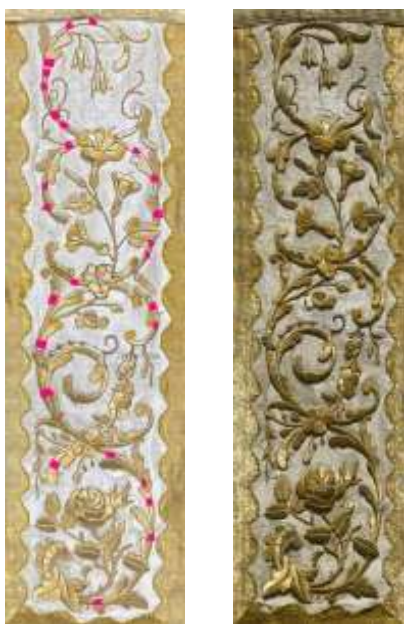
A miseruha középsávjának eltört papíralátöltései a bal oldalon lilával jelölve, mellettea restaurált, kiegészített miseruha középsáv

A miseruha elején több fémfonallal hímzett virágmotívum esetében viszont megfigyelhető volt, hogy a szirmok végeinek egy részén lebegnek a fémfonalak, s egy részük hiányzik is. A hímzés alátöltésének védelme érdekében szükségesnek ítéltam a nagyobb hiányok pótlását mercerezett pamut fonallal. Először a meglévő fémfonallas hímzések alá a kilátszó alátöltés formájára kivágott műanyag fóliát tettem, melyet 1-2 ponton kis Lascaux 303 HV akril ragasztóval rögzítettem. Ezután a fólia felületét beragasztottam, majd hagytam megszáradni. fémfonallas hímzést imitáló megfelelő színű mercerezett pamut fonallal beborítottam, a ragasztót hővel aktiváltam, így minden új fonalat a megfelelő helyre tudtam fixálni. Ezáltal a miseruha előlapjának hímzett díszítménye egységesebb megjelenésűvé vált.