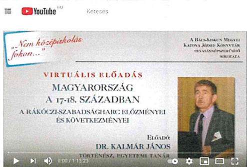
"Nem középkorolás fokon..." - Magyarország a 17-18. században

megragadva, magyarázva, anélkül, hogy a konkrét hadtörténeti eseményekre kitérne. Elemzi a szabadságharcot lezáró szatmári béke néven ismertté vált szerződést, és rövid kitekintést ad az ezt követő évtizedek fejlődésére. Végezetül azt a következtetést vonja le, a Rákóczi-szabadságharc a katonai vereség ellenére nem tekinthető hiábavalónak. A szatmári szerződés egy új korszakot nyitott, mely a korábbi másfél évszázadnál jóval előnyösebb lehetőségekkel biztosította Magyarország fejlődését.