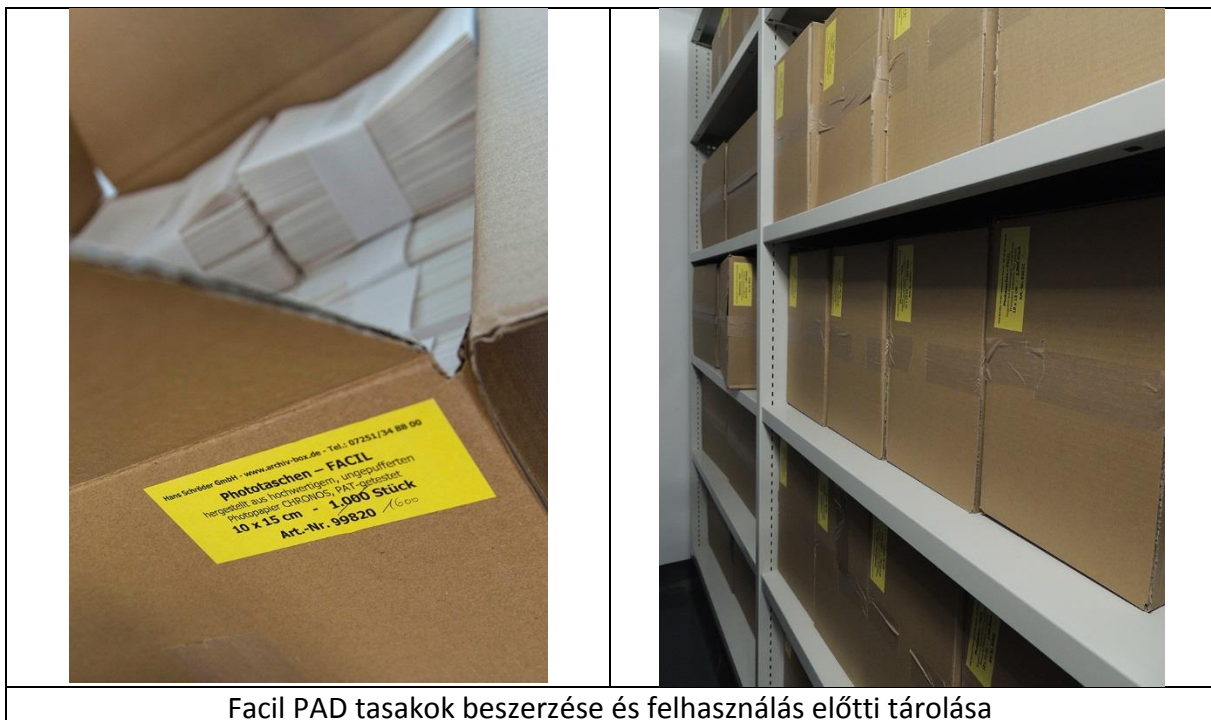
Facil PAD tasakok beszerzése és felhasználás előtti tárolása

Osztályunk archívuma számos olyan műről őriz fotódokumentációt, amely időközben már kikerült a gyűjtés- és művészettörténet látóköréből. E képanyag sok esetben egyetlen forrásként szolgálhat műtárgyak provenienciájának kutatásához és hatósági adatigénylésekhez. Ezért kiemelten fontos az állagvédelem és a korszerű tárolás és csomagolás biztosítása. A fotódokumentáció 1958-tól egészen a közelmúltbeli digitális átállásig folyamatosan bővült. A korábbi csomagolóanyagok, borítékok, papírtasakok már savasodásnak indultak. Az ezüst-zselatinos nagyítások emulziójának megóvása érdekében a csomagolóanyagok cseréje, illetve a különféle hordozók elkülönítése is szükségessé vált.