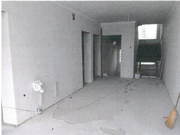
Folyosó, hátul a vizesblokk bejáratai