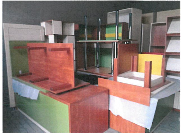
Az elhelyezéshez is szükségesek a szakértő kezek