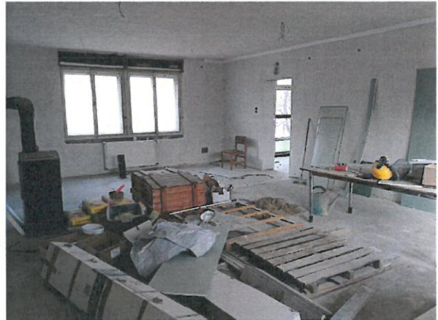
Könyvtár helyiség bejárata