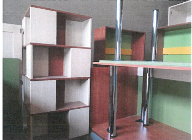
A médiapalc kivitelezése nem kis fejtörést okozott az asztalosnak, de kiválóan megoldotta a feladatot