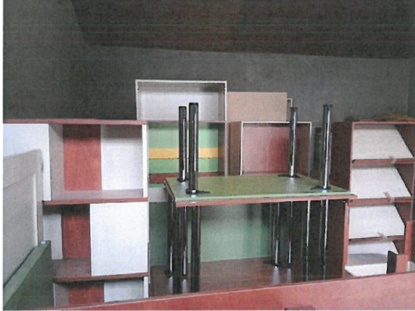
Gyönyörűen mutatnak az új bútorok még így is