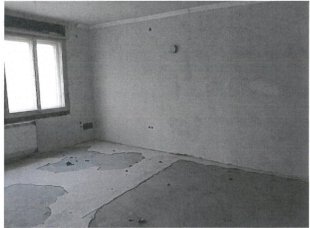
Iroda helyiség, és folyóirat olvasó sarok