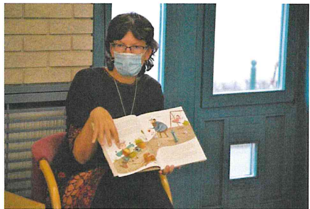
és a központi könyvtárban