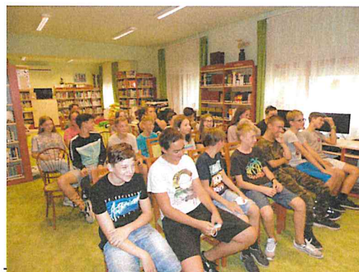
Sohonyai Edit és tiniközönsége Apostagon

Decemberben különleges élőlény költözött több család gyerekszobájába. Nem más, mint Slutty, az úrlény lett szobatárs, aki egyenesen Mészöly Ágnes meséjéből érkezett. A járványügyi helyzet ekkor már nem tette lehetővé a személyes találkozást, ezért az online teret töltötte meg játékkal, izgalmas történetekkel a meseíró. A felolvasásra választott részleteket, a hallottakhoz kapcsolódó beszélgetéseket és a könyvajánlást mindenütt élvezték a gyerekek.