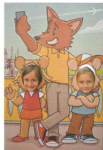
A „nyomozók” bőrébe bújva