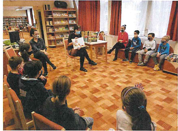
a Hunyadvárosi Fiókkönyvtárban