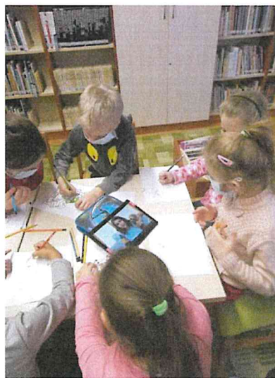
Hajóson tabletek segítették a kapcsolattartást