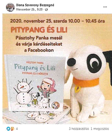
Az esemény plakátja a katymári könyvtáros oldalán