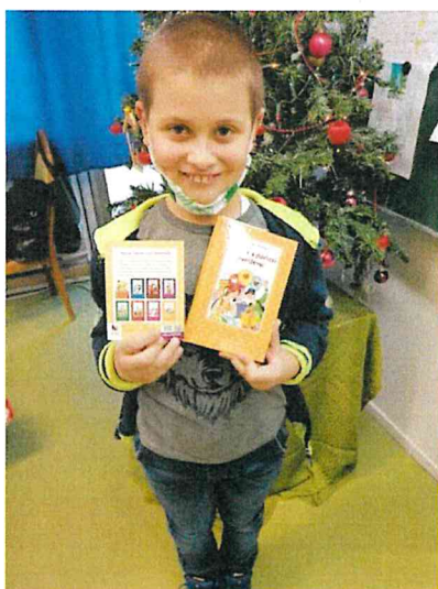
A gyerekeknek igazi meglepi volt a dedikált ajándékkönyv