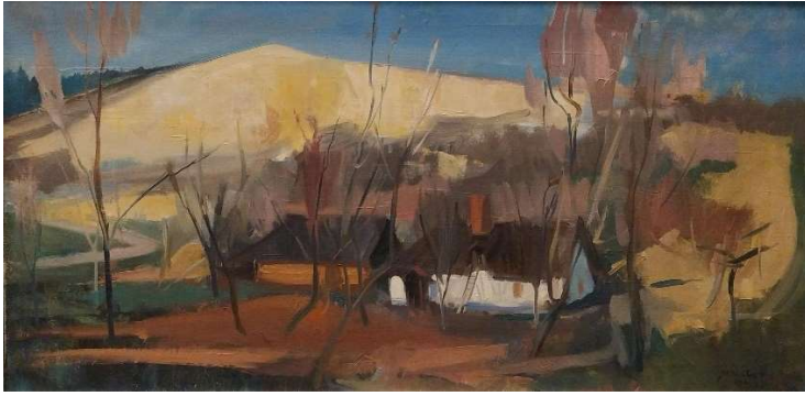
Mikus Gyula: Faluszéle