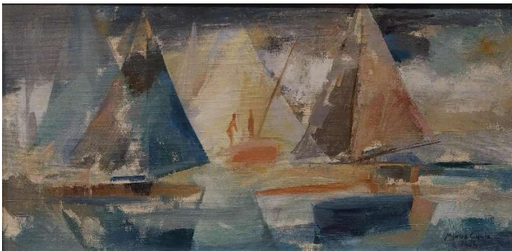
Mikus Gyula: Vitorlások