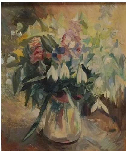
Mikus Gyula: Virágcsendélet