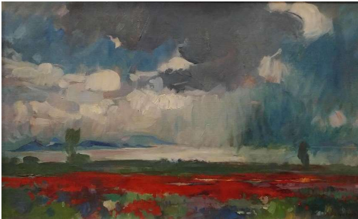
Mikus Gyula: Balatonyöröki táj