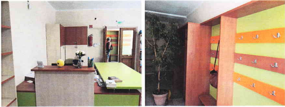
2-9. kép: képek az elkészült könyvtárról