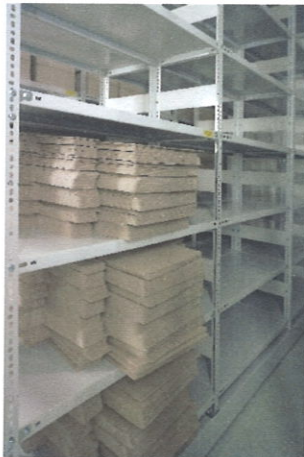
A kiterítve leszállított dobozok

Olyan típusú 686 darab savmentes irattartó dobozt vásároltunk, amelyet évek óta használunk, és ami a helykihasználásnak, a kialakított állványrendszernek, a polvtávolságoknak megfelel. A megvásárolt 686 darab doboz 68,60 iratfolyóméter iratanyag tárolásához elegendő.