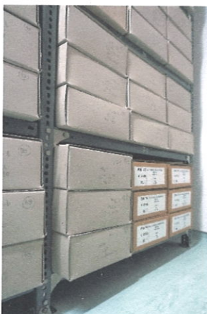
A savmentes dobozba átrakott és még átdobozolásra kerülő árvaszéki iratok

Vác Város Levéltára folyamatosan dobozolja át a régebben rendezett, nem savmentes dobozokban tárolt iratanyagot. Ilyen iratanyag a V. 94-b Vác Város Árvaszékének iratai, melynek átdobozolása jelenleg is folyik. A tervezett átdobozolás kb. 40%-át végeztük el, 1872-től az 1920-as évvel bezárólag. Az árvaszéki iratanyag 1950-el zárul.