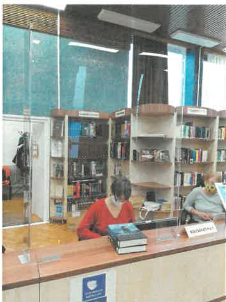
József Attila Könyvtár