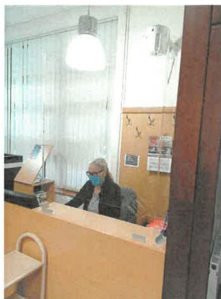
Kafka Margit Könyvtár