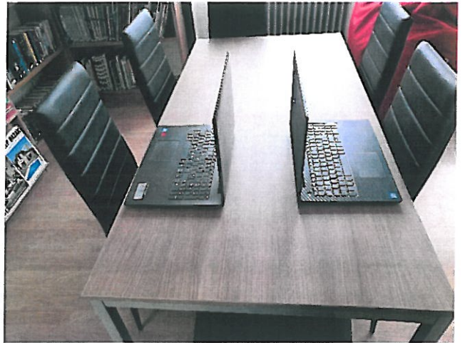
Képek a berendezés előtti állapotról: