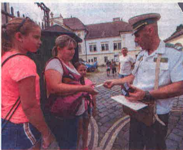
A határőrség hőkorát idézték meg Szécsényben, a Kubinyi Ferenc Múzeumban