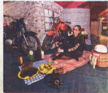
Akinek kedve témadát, a balassagyarmati Pannónia motorkezi-pár-múzeumban is nosztalgizálhatott