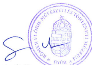
Grászli Bernadett, múzeumigazgató