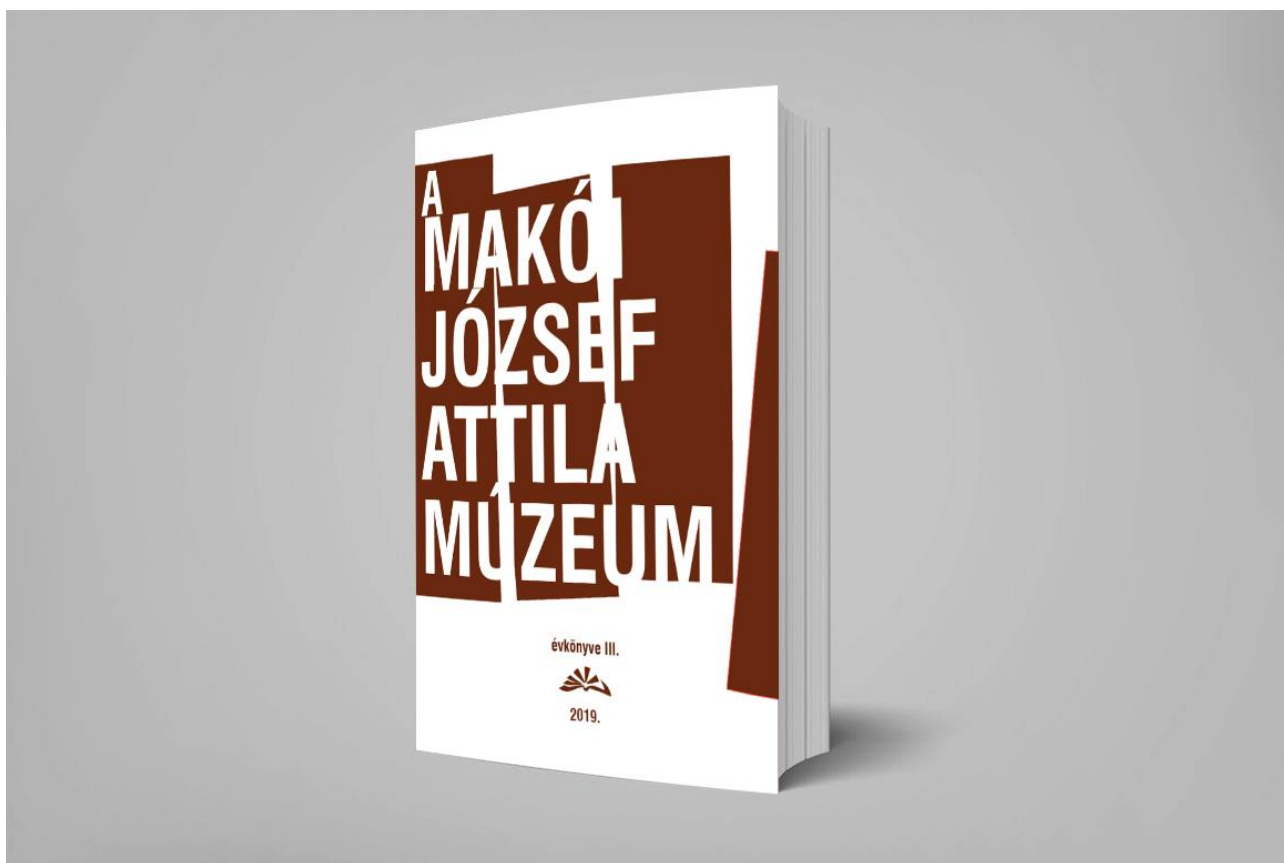
A Makói József Attila Múzeum évkönyve III. (2019)