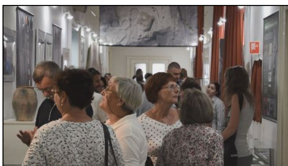
A kiállítás megnyitó képei