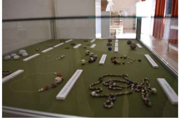
Fotók a kiállításról