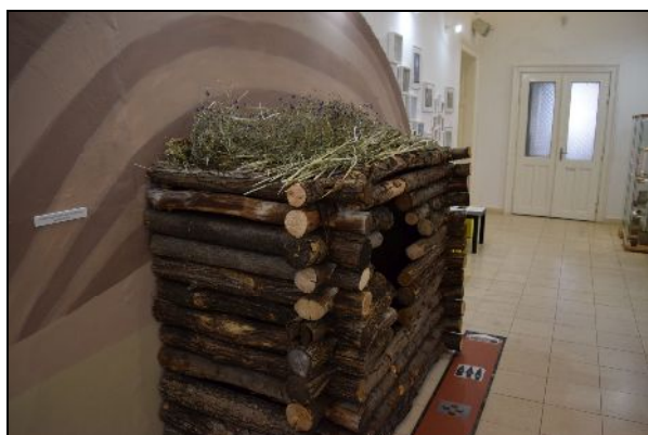
Fotók a kiállásról