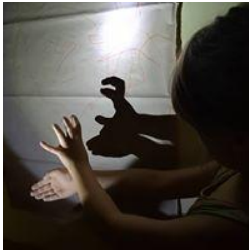
Budapest, 2018. március 29.