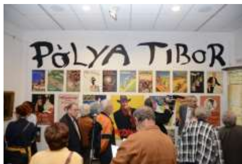
Részlet a megnyitóról. A kiállítást 3867 fő nézte meg.