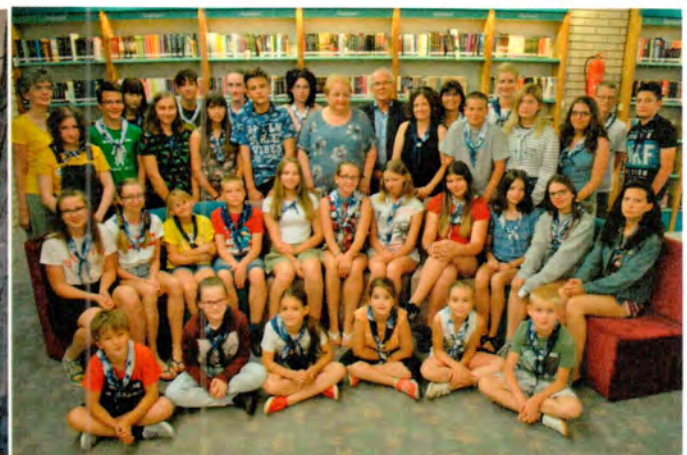
Vendégünk: Bahget Iskander fotóművész