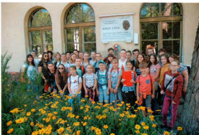
Kodály Zoltánra emlékezve