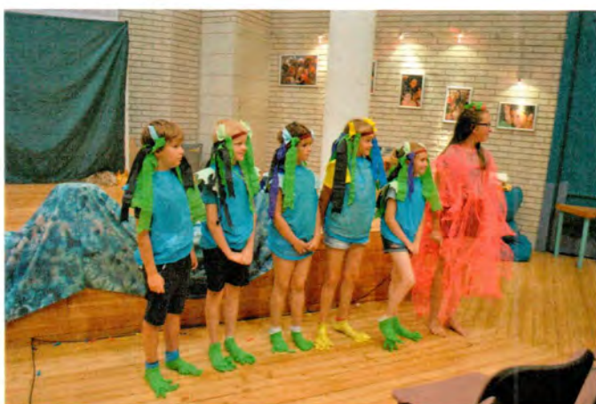
Fellépésre várnak a Gézengúzok