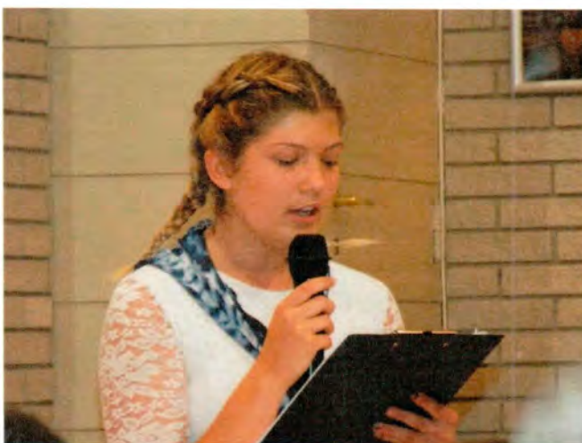
Kedves naplóm! Táborvégi visszatekintés