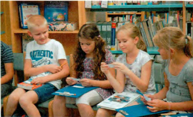
Megérkeztünk! – Ismerkedési játékok a katona József Könyvtárban