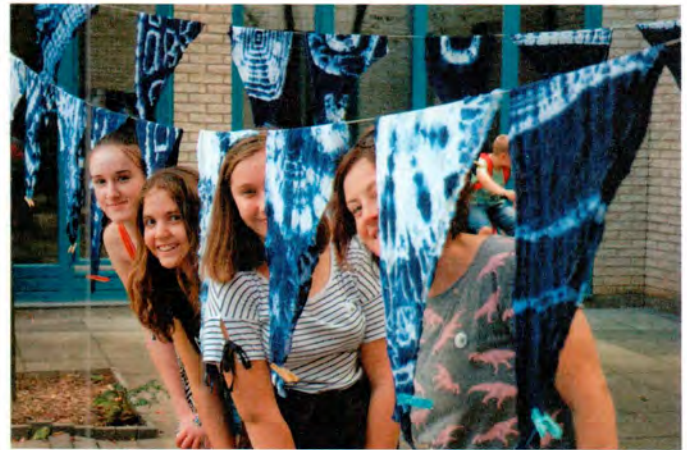
Száradnak a Kincskereső-kendők