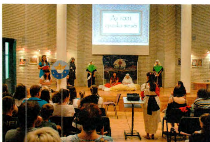
Színpadon a Ripacsok