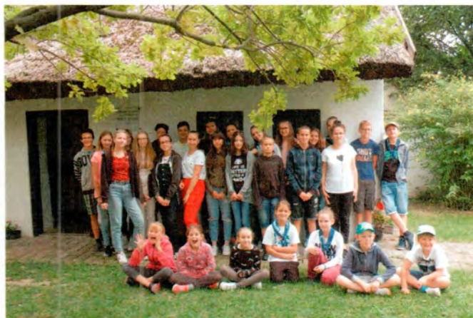
Kincskeresők Móra Ferenc szülőházánál