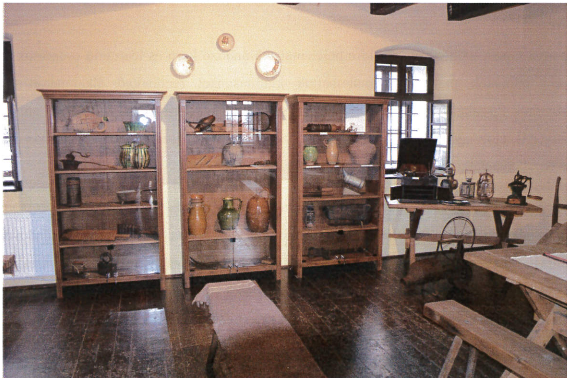
1. ábra: „Előrim: Elődeink eszközei” kiállítás

A hagyományőrzés a mi egyik legfontosabb feladatunk és ez a kiállítás is hozzájárult e nemes és feltétlenül szükséges feladat megvalósításához. Köszönet érte!