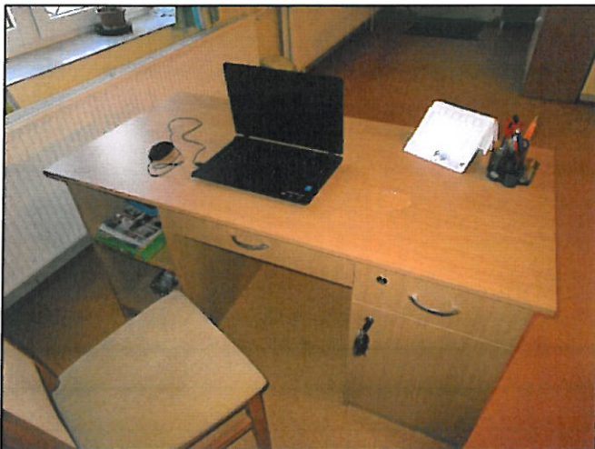
Új kölcsönzői asztal és laptop