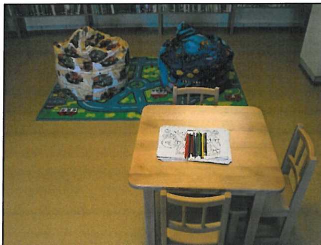
Új gyermekszőnyeg, gyermekasztal, gyermekszékek, babzsákok

(PVC padló egy másik pályázat eredménye)