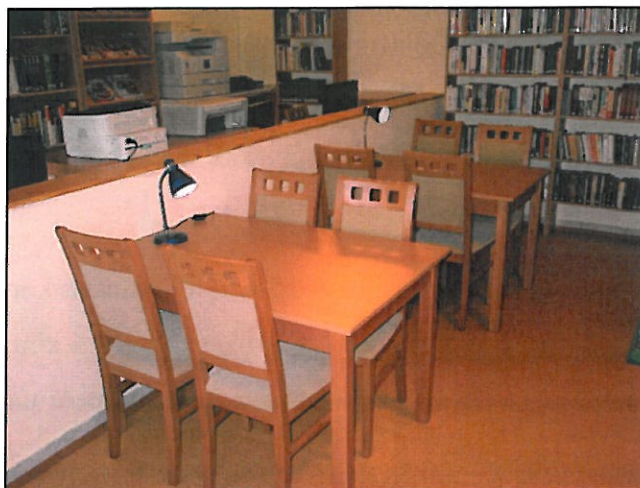
Új olvasóasztalok, székek