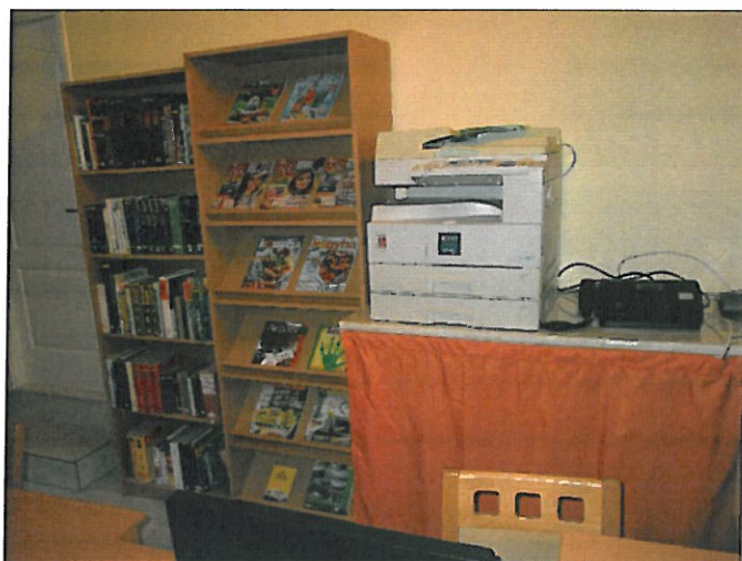
Új folyóiratállvány, könyvespolc, függöny