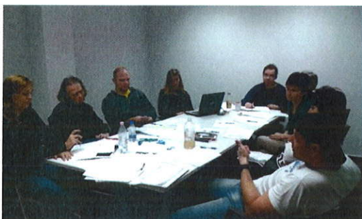
Belső továbbképzés 2015. szeptember 14.

Az Egyetemi Könyvtárban voltak előzményei a minőségfejlesztésnek már 2009-ben is. 2015-ben újra elkezdtünk foglalkozni a minőségfejlesztéssel. Újjáalakult a MIT ügyrendje elkészült, és jónéhány dokumentumunk is megvolt a továbbképzés előtt, így a munkatársak tudták, ismerték a folyamatokat, könnyebben tudtak azonosulni a minőségfejlesztés fontosságával. A képzés előtt a munkatársak megismerkedtek az önértékelés folyamatával egyrészt belső továbbképzéseken, másrészt Vidra Szabó Ferenc: Könyvtári Közös Értékelési Keretrendszer c. könyve alapján.