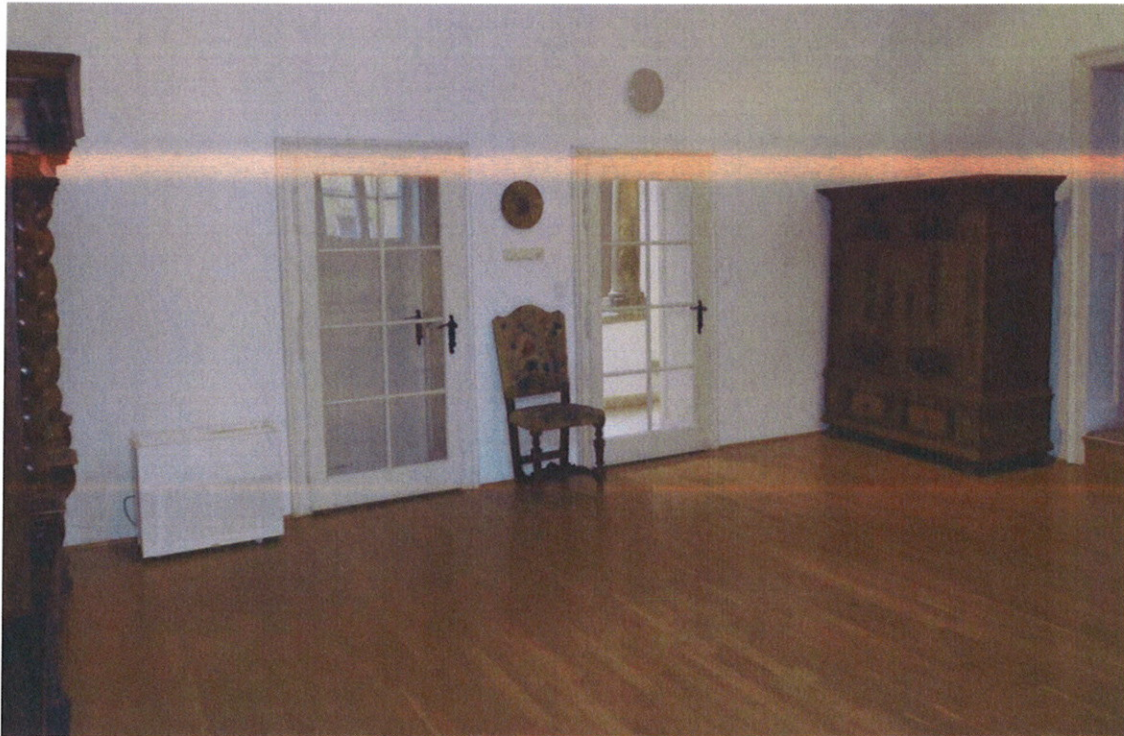
Párásító készülék a kiállítótérben