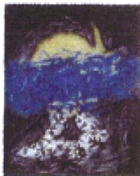
Visszanéző 75 x 60 1991