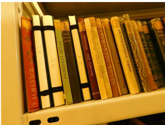
5.-6. kép: A károsodott kötetek savmentes védőtokba helyezése