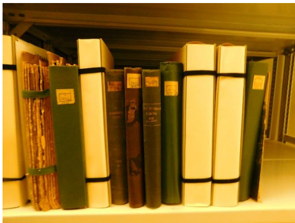
7.-8. kép: Az „Érdekes Újság” sérült évfolyamai nagy méretű, savmentes védőtokban lettek elhelyezve