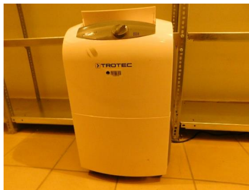
1.-2. kép A könyvtári raktárban elhelyezett páramentesítő készülékek

A szakmai anyagok beszerzésére fordítható összegből a múzeum művészeti tárának fotógyűjteménye, a kéziratár és a könyvtár rossz állapotú könyv-és folyóirat gyűjteménye számára vásároltunk tároló anyagokat.