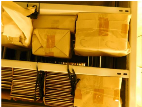
3.-4. kép: A különböző méretű, savmentes papírral bélelt, füles-megkötős tékák