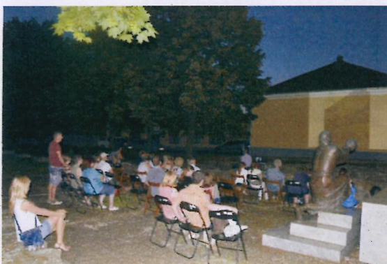
19. ábra Görög tájakon