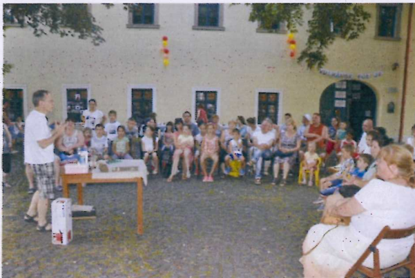
8. ábra Tűzhányók kitörésben; Harangi Szabolcs interaktív előadása

Dr. Harangi Szabolcs, az Eötvös Loránd Tudományegyetem Közöttani és Geokémiai Tanszékének professzora ezúttal Pásztón, a Romkertben alapított vulkánobszervatóriumot. Az obszervatórium kutatói a közönség soraiból verbuválódtak, de a játék résztvevői nem feledkeztek meg egy vulkánkitörés lehetséges társadalmi hatásairól sem, így a szerepjátékban megjelenítették a katasztrófavédelem és a városvezetés képviselőit is. A játékban kicsik és nagyok egyaránt remek hangulatban vettek részt. A bemutató végén a vulkánkitörés sem maradt el.