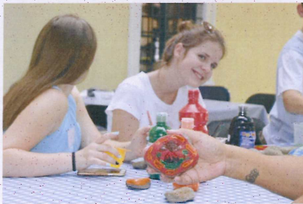
5. ábra Kavicsfestés