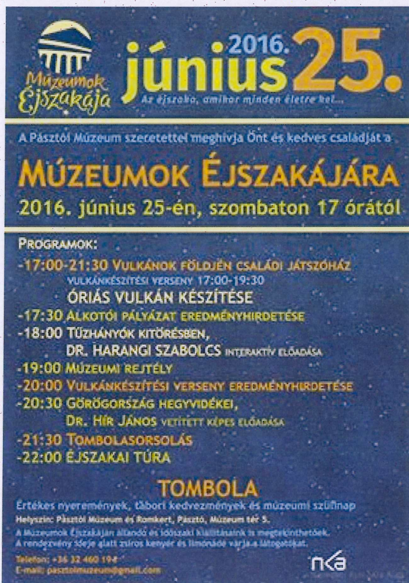
I. ábra Vulkánok földjén. Múzeumok Éjszakája a Pásztói Múzeumban. A rendezvény plakátja.

Idei Múzeumok Éjszakája programjainkat, a vulkánok köré szerveztük. A téma jól illeszkedett az országos rendezvény Hősök, felfedezők, újtók címen futó kiemelt témájához.