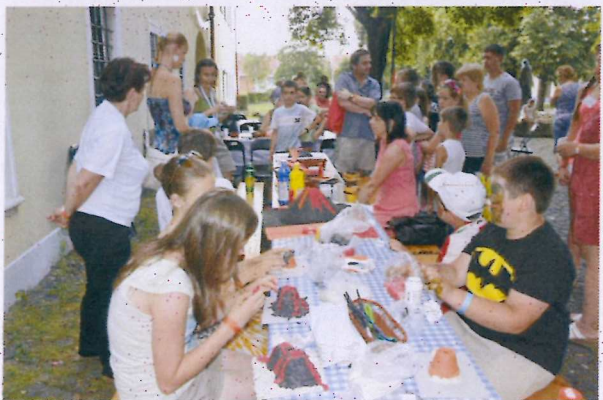
4. ábra Vulkánkészítés