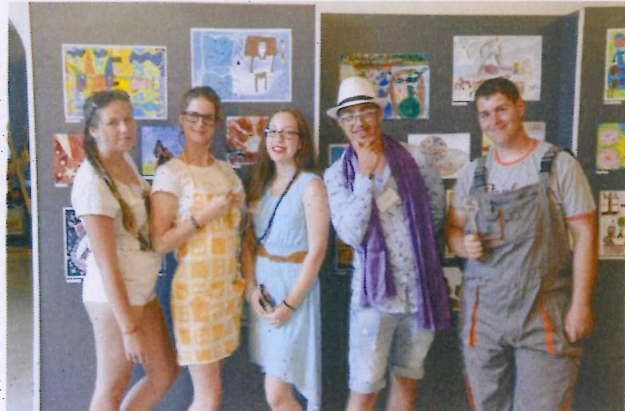
15. ábra Gyanúsítottak, iskolai közösségi szolgálatos segítők.