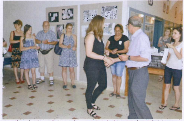
7. ábra A középiskolás korosztály is képviseltette magát.