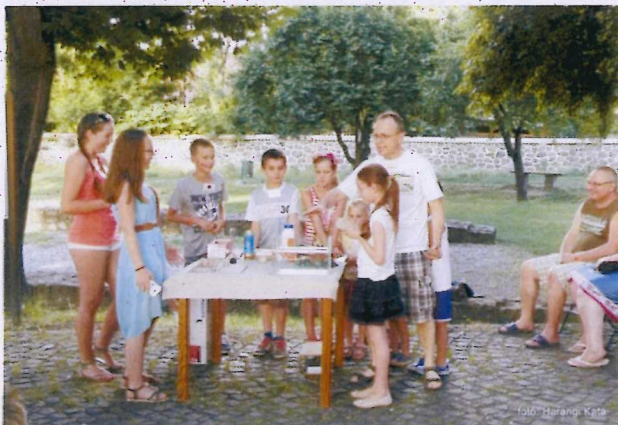
10. ábra A teljes vulkánobszervatórium.