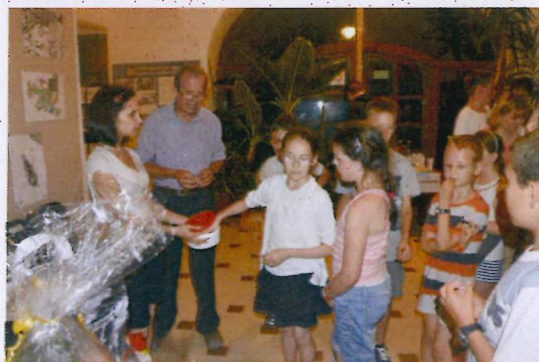
20. ábra Tombolasorsolás

Hagyományainkhoz híven, szponzoraink segítségével idén is sorsoltunk tombolát. Múzeumi foglalkozás, múzeumi szülinapi buli is gazdára lelt.