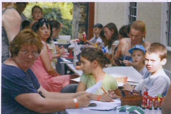
2. ábra Családi játszóház

A játszóház idejére, 17:00 és 19:30 között, vulkánkészítési versenyt hirdettünk.