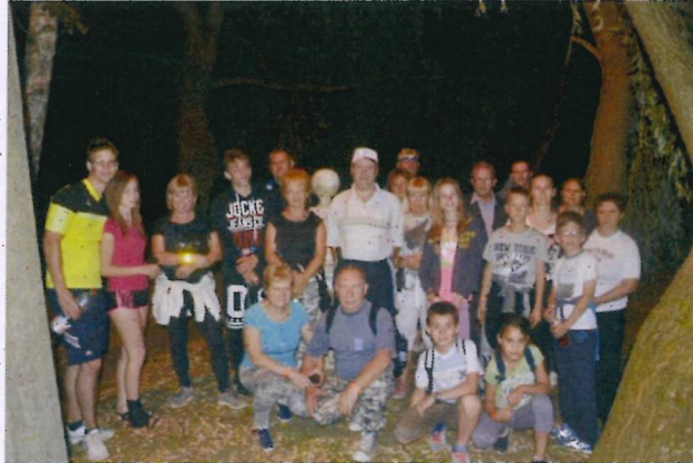
21. ábra Kirándulás a Csúd-hegyre

A tavalyi sikerre való tekintettel, a Nyikom Hegyisport és Természetvédő Klubbal együttműködve, idén is szerveztünk éjszakai túrát. A Pásztó közelében fekvő Sámsonháza melletti Csúd-hegyre sétáltunk fel. A települést személygépkocsikkal közelítettük meg, majd a falu határából gyalog indultunk el. A dombtetőről pazar kilátás nyílt a közeli települések (Sámsonháza, Nagybárcány, Tar és Pásztó) éjszakai fényeire. A kiránduláson az általános iskolásoktól a nyugdíjasokig több korosztály képviseltette magát.