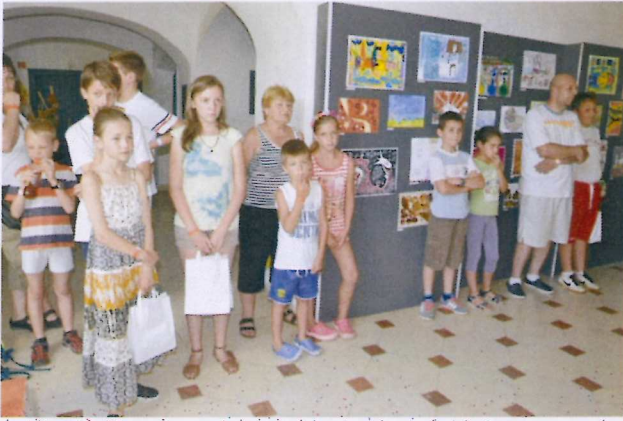
6. ábra A tudomány is lehet szép! pályázatunk díjátadója