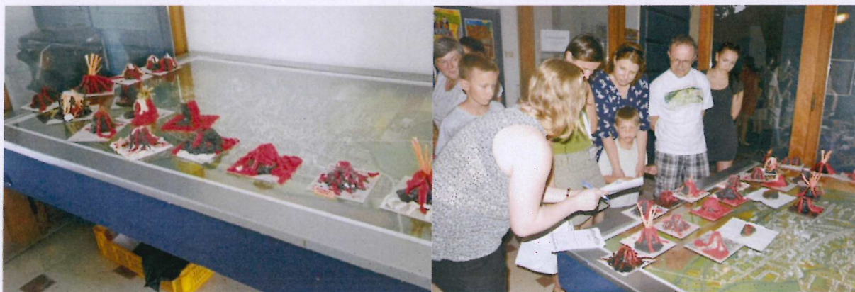
16. ábra Gyűlnek a vulkánok