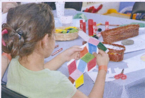
3. ábra Gránát kristályforma készítése