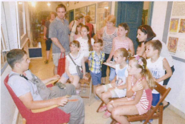
14. ábra Kihallgatás