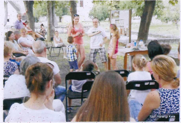
9. ábra Kutatótoborzás.