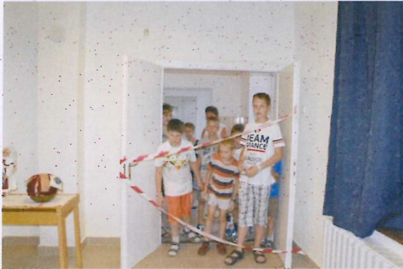
12. ábra A bűntény egyik helyszíne

Idén is nyomozó játékra hívtuk a gyerekeket. A múzeum belső tereiben három tethelyet alakítottunk ki: mindegyikből eltűnt egy-egy műtárgy. A hiányzó műtárgyakat és a tettesek kilétét a játékban résztvevő gyerekeknek kellett felfedniük, úgy, hogy múzeumi kísérelő segítségével bejárhatták a bűntény helyszíneit, ahol nyomokat gyűjthettek (a nyomkereséshez rendelkezésükre állt kesztyű, ecset, gyűjtőzacskó stb.), majd a nyomok tanulmányozása (nagyító, sztereomikroszkóp használatával) után kihallgathatták a gyanúsítottakat is. A játék megvalósításában iskolai közösségi szolgálatot teljesítő középiskolás diákok voltak segítségünkre.