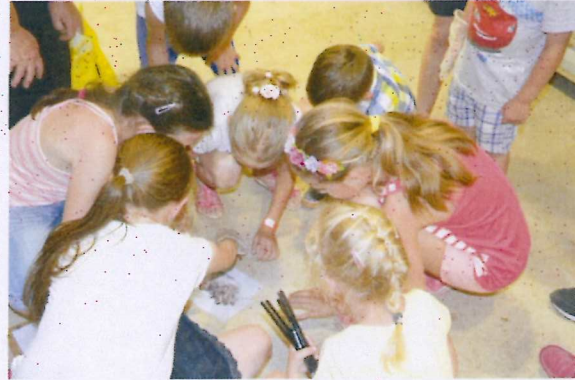
13. ábra Helyszínelők