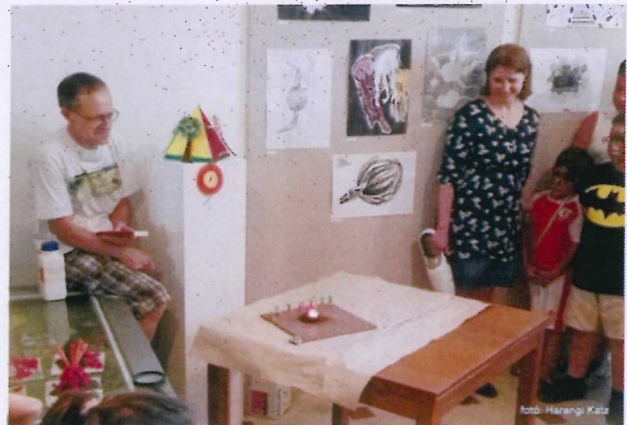
11. ábra A vulkánkitörés sem maradt el.