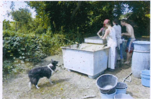
4. ábra Iszapolnak