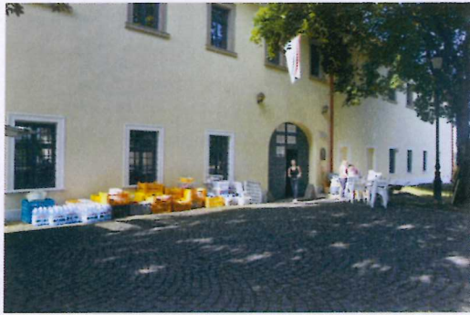
1. ábra Indulásra készen