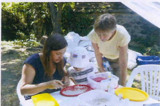
5. ábra Látogatóban Hamupipőkénél