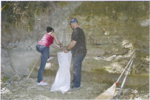
3. ábra Munkában a bányász brigád