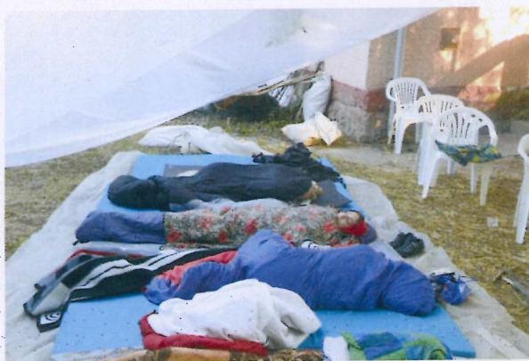
10. ábra Egy nehéz reggel