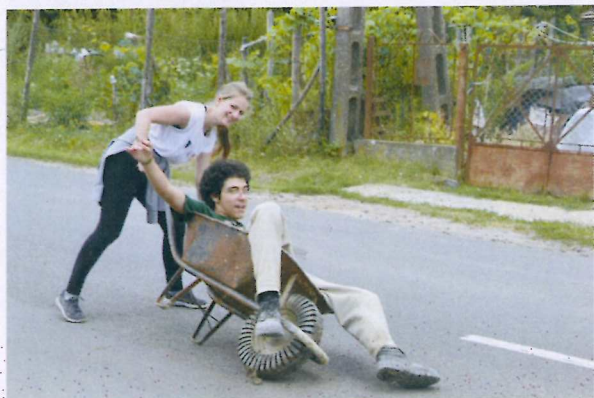
9. ábra Életkép napközben