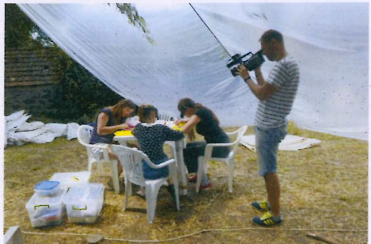
6. ábra Készül a videóriport