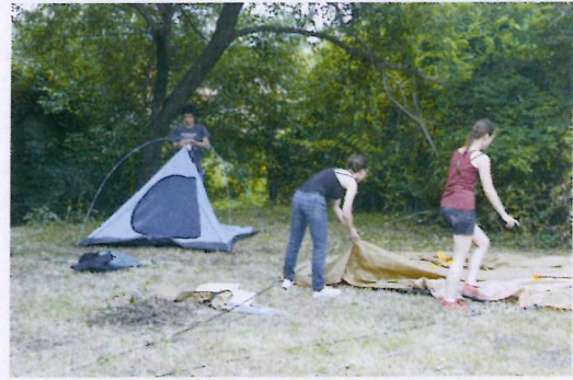
2. ábra Sátorverés