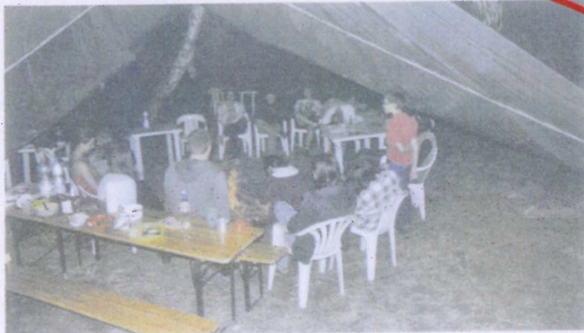
A Pásztói Múzeumt már 32. alkalommal rendezte meg az Őszi nyári Kiszáradt Kertek