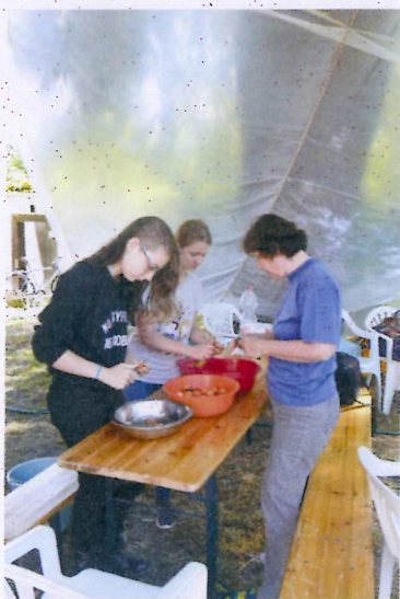
7. ábra Magunkra főztünk