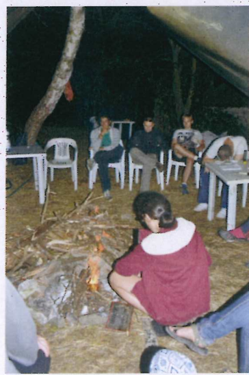
8. ábra Esti tábortűznél