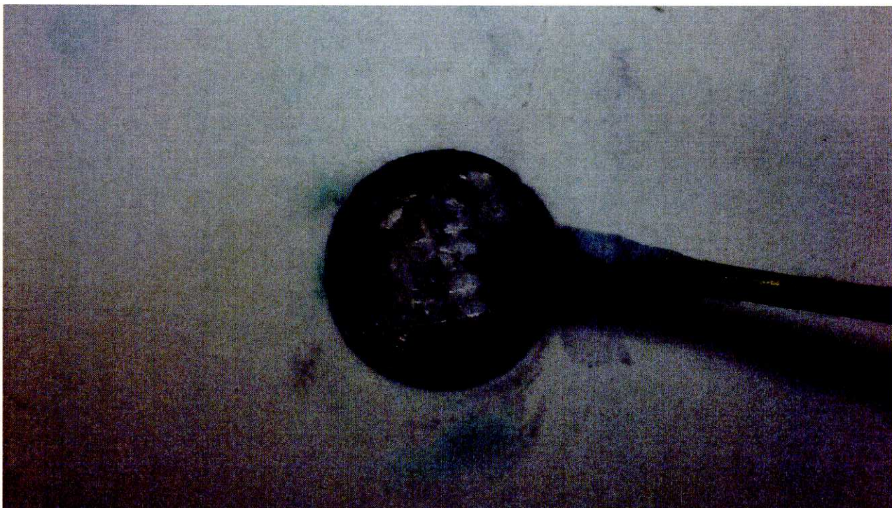
Ezüst pénz restaurálás közben – korróziós termékek eltávolítása vegyszerekkel