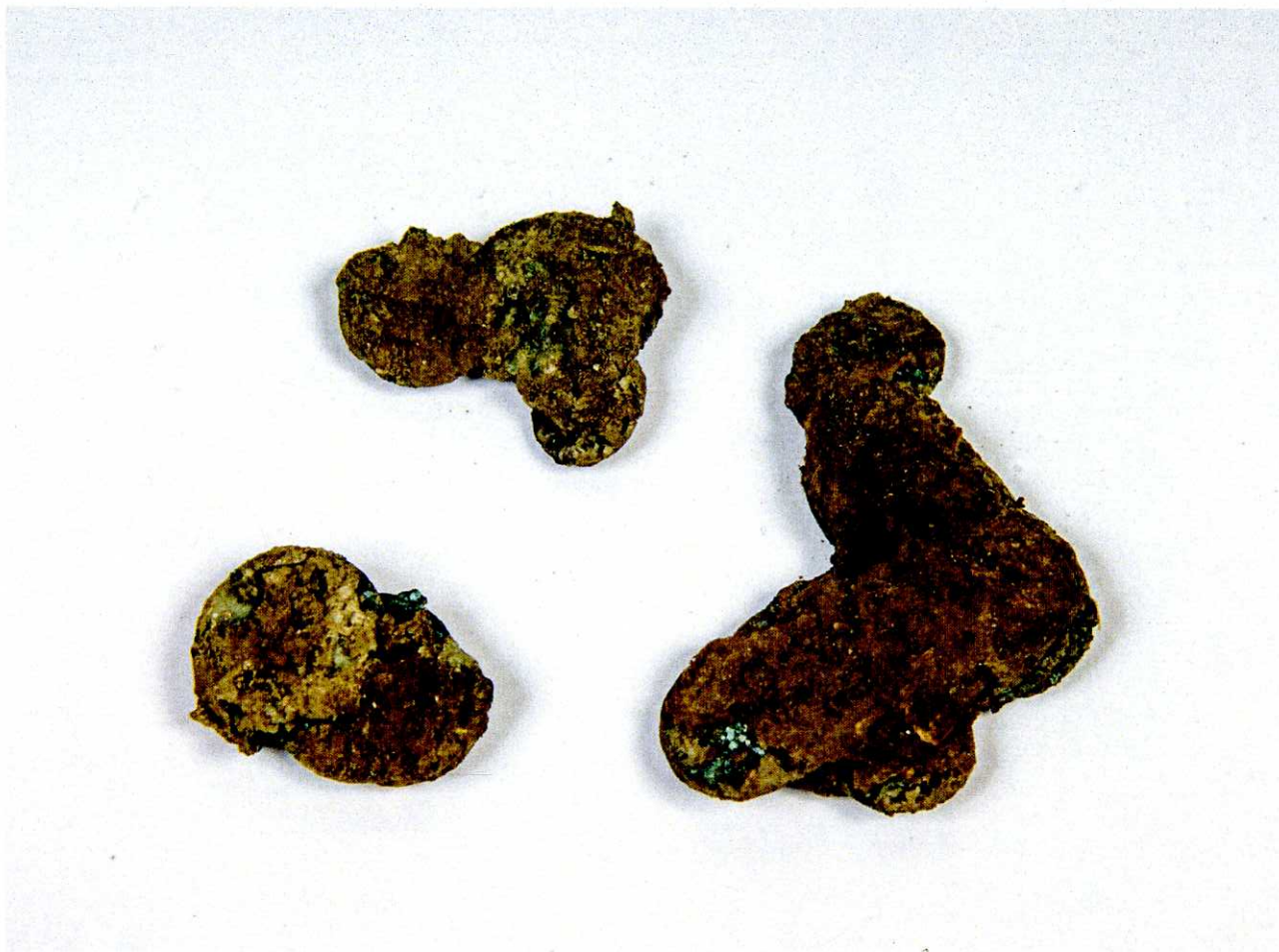
Ezüst lelet restaurálás előtti állapota