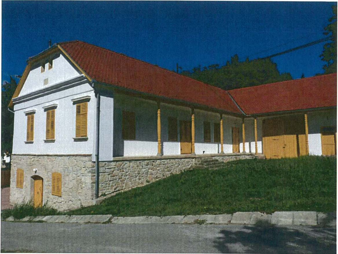
Mecseknádasdi Német Nemzetiségi Tájház