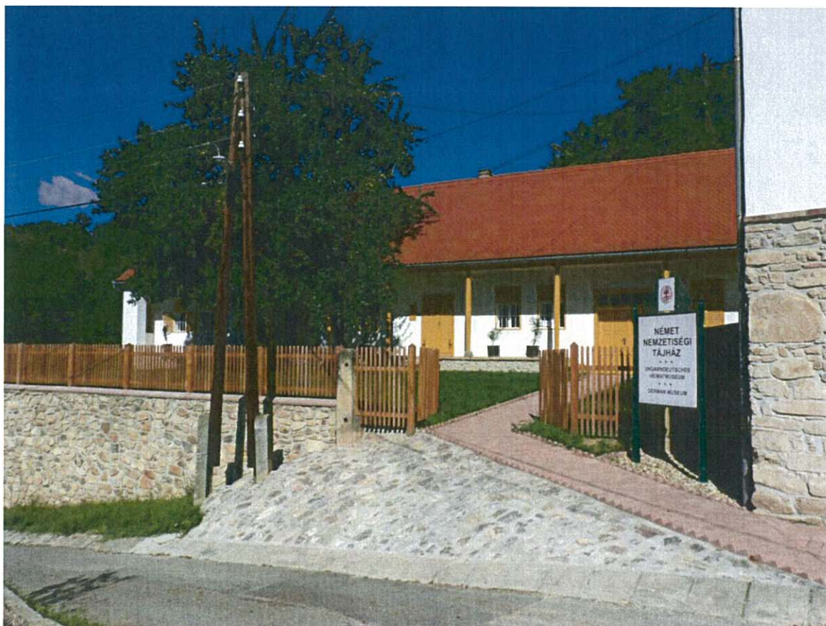
Mecseknádasdi Német Nemzetiségi Tájház

Mecseknádasd Önkormányzata nettó 500.000 FT támogatást nyert a Mecseknádasdi Német Nemzetiségi Tájház állományvédelmi fejlesztésére és eszközbeszerzésre. Eredetileg 977900 Ft-ot pályáztunk. A fejlesztés megvalósulásához az Önkormányzat 477.900 FT-tal járult hozzá. Az eredeti árajánlatok alapján a riasztórendszer kiépítése 317500 FT-ba, (nettó és bruttó) a szúnyogháló kiépítése (anyagköltséggel együtt) 660400 FT-ba, (nettó és bruttó) került.