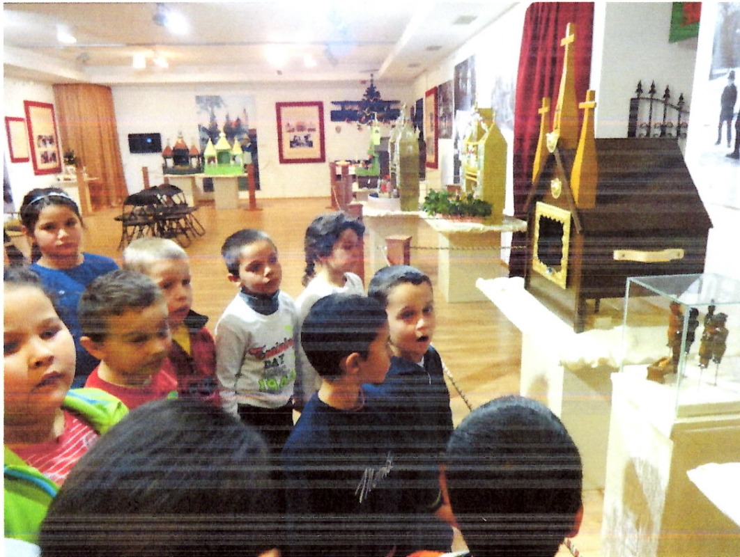
Óvodások a kiállításban - Interaktív tárlatvezetés