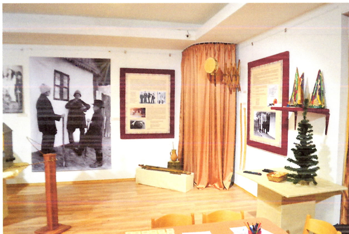
A regölés és a háromkirályjárás bemutatása