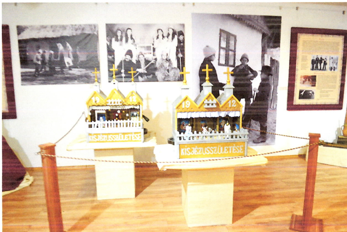
A holládi betlehemek (balról az eredeti, jobbról a műtárgymásolat)