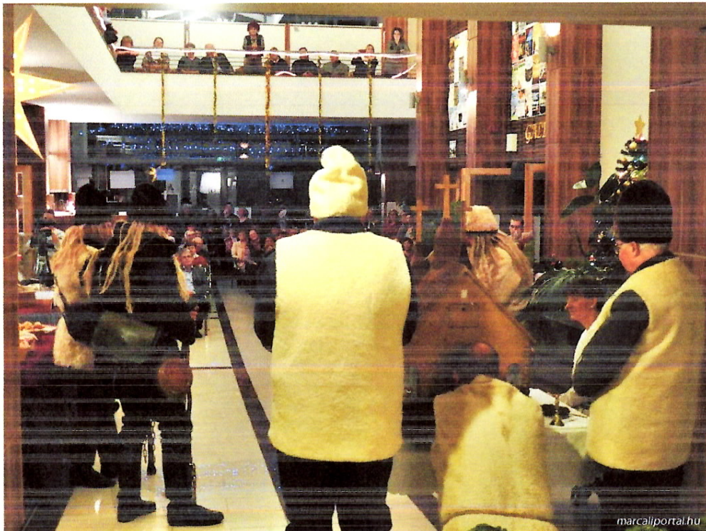
A „ Betlehemnek szép határán.... ” A téli ünnepekör népszokásai Marcaliban és környékén című időszak kiállítás ünnepélyes megnyitója. Előtérben a közreműködő Vörsi Báltáncoltató Betlehemezők csoportja.