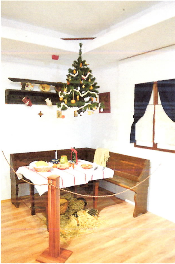
A karácsonyi asztal