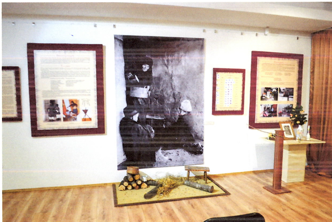
A lucázás és a szentcsaládjárás