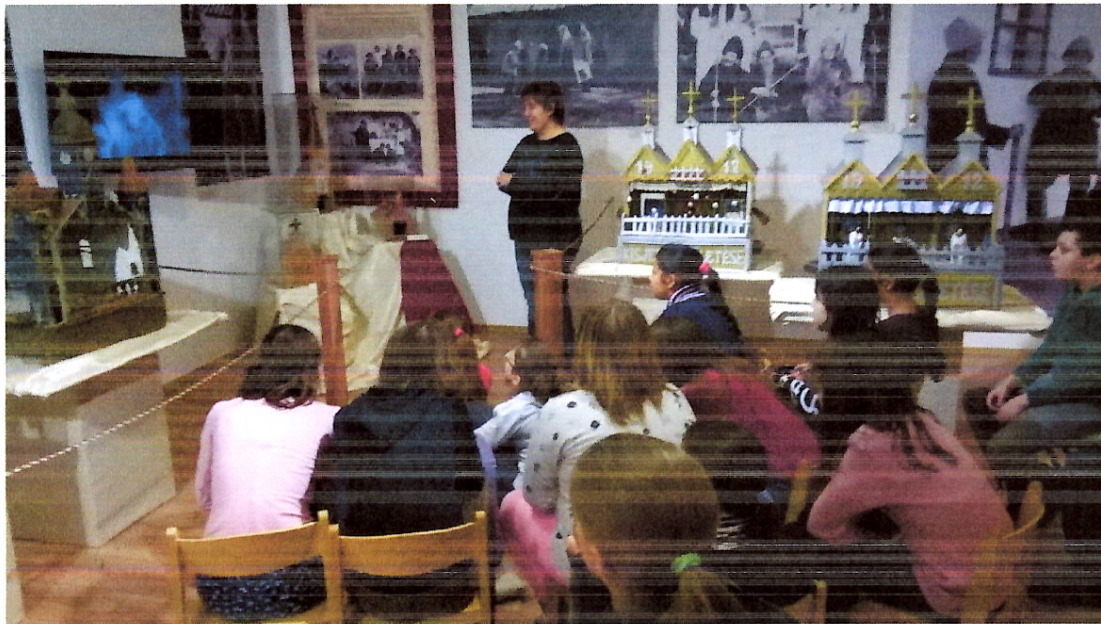
Általános iskolások a betlehemezést bemutató filmet tekintik meg a tárlatban