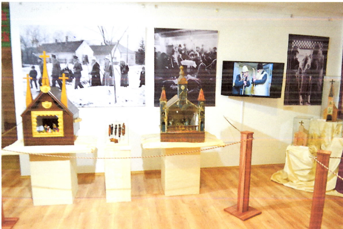
A vörsi betlehem (másolat) és a kéthelyi 1905-ben készült betlehem. A kép szélén zalai betlehemek