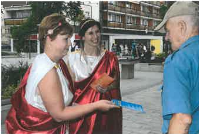
2. kép: Információs nap a Kossuth utcán