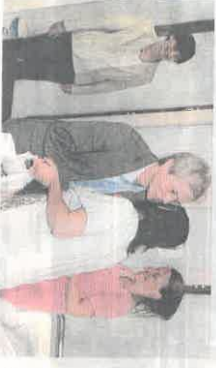
A köszöntés a Csolnoky Ferenc Kórházban.