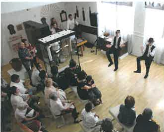
3. kép: Kiállítás megnyitó, Tulipán, pelikán, kígyó