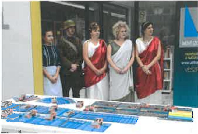
1. kép: Információs nap