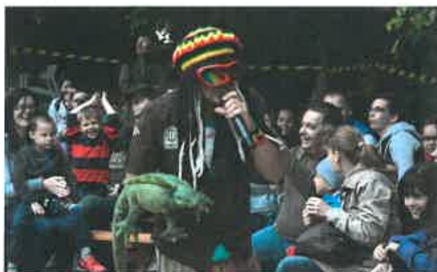
7. kép: MintaPinty zenekar fellépése