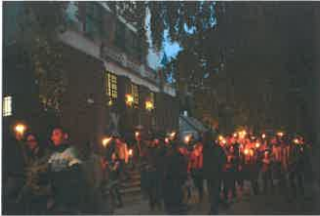
9. kép: Fáklyás felvonulás