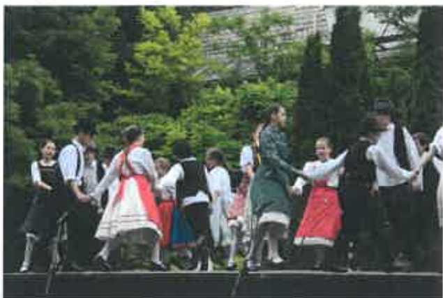
8. ábra: Kis-Bakony Táncegyüttes