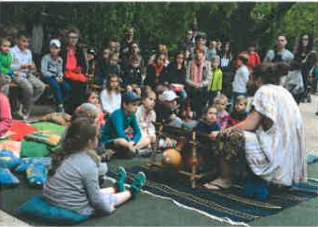
5. kép: Kabóca Bábszínház előadása