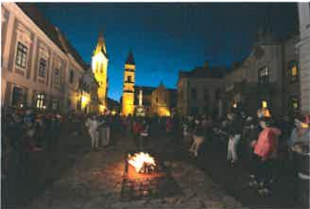
10. ábra. Tűzgrás a Dubniczay Palota előtt