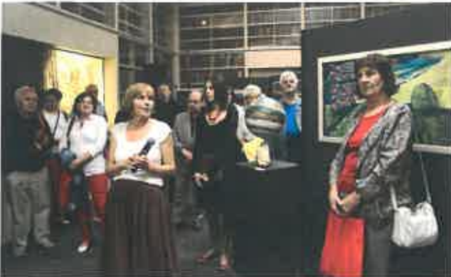
4. kép: Kiállítás megnyitó, Szent Iván éj a Buhim völgyben