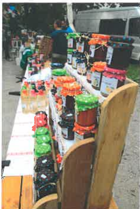
6. kép: Kirakodó vásár a múzeumkertben