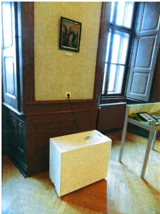
Defensor PH15 működés közben